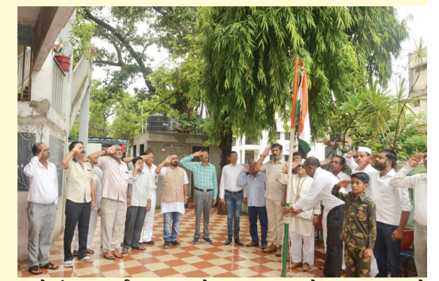
હાથોમાં ધ્વજ લઈ ફરતા નજરે પડતા હતા વાહનચાલકો પણ રાષ્ટ્રધ્વજ વાહનોમાં યોગ્ય સ્થળે લગાવી ઠેર ઠેર પસાર થતા નજરે પડતા હતા મોડાસાના આસપાસે કેસરી, સહેદ અને લીલા રંગના ગુબ્બારા થી ભારતીય રાષ્ટ્ર ધ્વજનો ગુજરો સર્જાયો હતા.

વિદ્યાલય, કરમિયા ગર્લ્સ હાઈસ્કૂલ, બી-કનઈ, પ્રાર્થના વિદ્યાલય, સરકારી કચેરીઓ, જીલ્લા પંચાયત, તાલુકા પંચાયત, ભારતીય જનતા પાર્ટી, મોડાસા શહેર કોંગ્રેસ પાર્ટી, અર્ધ સરકારી કચેરીઓમાં ૭૩ માં સ્વાતંત્ર્ય દિન નિમિત્તે ધ્વજ વંદન, વિવિધ સાંસ્કૃતિક કાર્યક્રમો, દેશભક્તિ ઉજાગર કરતા નાટકોનું આયોજન કરવામાં આવ્યું હતું. સમગ્ર મોડાસા શહેર દેશભક્તિના રંગે રંગાતા ધંધા રોજગારના સ્વર્ણ રહેણાંક વિસ્તારોમાં ભાગકો અને મોટેરાના