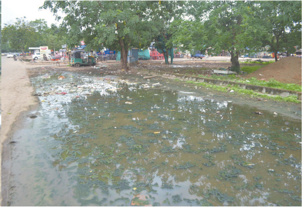
ગાંધીનગર શહેરની ખાણીપીણી બજાર ગંદકીથી બદબાઈ રહ્યું છે. ગંદકીને પગલે મચ્છરોનો ત્રાસ વધતા નાગરીકોના આરોગ્ય સામે પણ ખતરો મંડરાઈ રહ્યો છે. એક તરફ ચોમાસાની ગંદકી તેમજ ખાણીપીણી બજારની ગંદકીને પગલે આ વિસ્તારમાં દુર્ગંધથી માથુ ફાટી જાય તેવી દુર્ગંધ મારે છે. ત્યારે લીલના પછ ધર જામતા આ વિસ્તારમાં ગંદકીનું સામાજિક ફેલાવું હોય તેવી સ્થિતિનું નિર્માણ પામ્યું છે. ત્યારે આ વિસ્તારમાં ગંદકી તાત્કાલીક ધોરણે દુર થાય તેવી લોકમોગ પ્રબળ બનવા પામી છે.