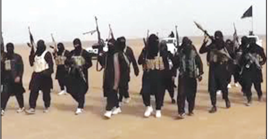
શ્રીનગર, તા. ૨૧ જમ્મુ કાશ્મીરને ખાસ દરજ્જો આપતી કલમ ૩૭૦ને નુબાબુદ કરવામાં આવ્યા બાદ પાકિસ્તાનની સતત ઉંચ દરામ થયેલી છે. જેના ભાગરૂપે કાશ્મીરમાં રક્તપાત જારી રાખવા અને અસ્થિરતાના માહોલને જાળવી રાખવા માટે તેના દ્વારા દરેક હરકત કરવામાં આવી રહી છે. એકબાજુ પાકિસ્તાન દ્વારા જમ્મુ કાશ્મીરમાં ત્રાસવાદીઓને યુસાડી દેવા માટે અંકુશ રેખા અને આંતરરાષ્ટ્રીય સરહદ પર યુદ્ધવિરામનો ભંગ કરીને

આઈએસઆઈ દ્વારા ત્રાસવાદીઓની મોટાપાયે ભરતી શરૂ કરાઈ : યુવાનોને ત્રાસવાદી સંગઠનોમાં સામેલ થવા અને તેમને હથિયારોની તાલીમ આપી ત્રાસવાદી બનાવવા માટેની ખતરનાક હરકતોમાં આઈએસઆઈ વ્યસ્ત