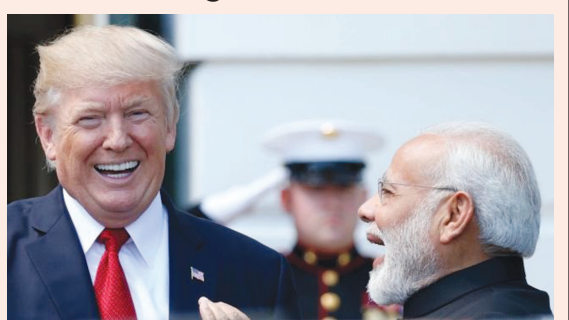
નવીદિલ્હી, તા. ૨૫ વડાપ્રધાન નરેન્દ્ર મોદી અને અમેરિકી પ્રમુખ ડોનાલ્ડ ટ્રમ્પ વચ્ચે આવતીકાલે સોમવારના દિવસે મહત્વપૂર્ણ બેઠક યોજનાર છે. આ બેઠકથી પહેલા અમેરિકાએ કહ્યું છે કે, મોદી સાથેની વાતચીત દરમિયાન કાશ્મીર ઉપર પણ ચર્ચા થશે. અમેરિકી પ્રમુખ કાશ્મીરમાં માનવ અધિકારોની સુરક્ષા માટે લેવામાં આવી રહેલા પગલાઓ અંગે માહિતી મેળવશે. જો કે, અમેરિકાએ ફરી એકવાર કહ્યું છે કે, કલમ ૩૭૦ને દૂર કરવાની બાબત ભારતનો આંતરિક મામલો છે. શનિવારના દિવસે જ ટ્રમ્પ વહીવટીતંત્રના અધિકારીઓ કહી ચુક્યા છે કે, અમેરિકા-ભારત-પાકિસ્તાન વચ્ચે તંગદિલી ઓછી કરવાની રણનીતિ ઉપર કામ કરી રહ્યું છે. સરહદપારથી યુસુફખોરીને રોકવા, કાશ્મીરમાં ટેરર ફંડિંગને રોકવા અને અન્ય ગ્રાસરોટ્ટીઓની મદદ કરવા માટે પાકિસ્તાનની ગતિવિધિ ઉપર નજર રાખવાની બાબતનો સમાવેશ થાય છે. ભારતને કાશ્મીરમાં સ્થિતિ સામાન્ય બનાવવા માટે પ્રોત્સાહિત કરવા અને માનવ અધિકારોની સુરક્ષાની ખાતરી કરવાના પ્રયાસો પણ કરવામાં આવી રહ્યા છે. ટ્રમ્પ અને મોદી વચ્ચે યોજનારી બેઠક પર વિશ્વ સમુદાયની નજર છે.