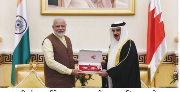
અબુધાબીમાં યુનાઈટેડ આરબ એમિરાતના સર્વોચ્ચ નાગરીક મોહમ્મદ બિન ઝાયેદ અલ નાહયાન દ્વારા એમને એનાયત

બેહરીન, તા. ૨૫ વડા પ્રધાન નરેન્દ્ર મોદીને ૨૪ ઓગસ્ટ, શનિવારે પુરસ્કાર ઓફ ઓફ ઝાયેદથી નવાજવામાં આવ્યા હતા. આ એવોર્ડ એમને પાટવીકુંવર