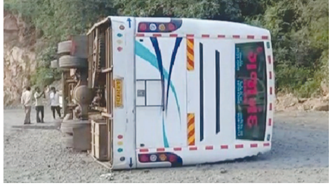
મોટી રાત્રે ૬૫ મુસાફરો ભરેલી લકઝરી બસ પલટી જતાં ૪૫ મુસાફરોને ઈજા પહોંચી છે. આ લકઝરી બસનાં મુસાફરો અંબાજીથી દર્શન કરીને આવ્યા હતાં અને મહેસાણા જઈ રહ્યાં હતાં.

અંબાજી, તા. ૨૬ દાંતા પાસે આંબાઘાટા ખાતે આવી હતી, જે બાદ ત્યાંથી વધુ સારવાર માટે થોડા લોકોને અમદાવાદ સિવિલ હોસ્પિટલમાં લઈ જવામાં આવ્યા હતા જ્યારે મેરાલુ મહેસાણા અને વડનગર ખાતે સારવાર આપવામાં આવી રહી છે.