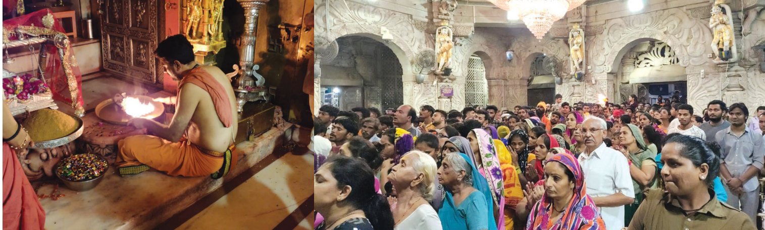
અંબાજી મંદિરમાં જન્માષ્ટમી પર્વ રંગેરંગે ઉજવાયો : ગુજરાતના લોકપ્રિય શક્તિપીઠ અંબાજી મંદિરમાં શુક્રવારની રાત્રે બાર વાગે અંબાજી મંદિરમાં આરતી કરવામાં આવી હતી અને શ્રી કૃષ્ણ જન્મ પર્વ ઉજવવામાં આવ્યો હતો મોટી સંખ્યામાં ભક્તો હાજર રહ્યા હતા અંબાજી મંદિરમાં જન્માષ્ટમી અને શિવરાત્રીના દિવસે રાત્રે બાર વાગે આરતી કરવામાં આવે છે. શુક્રવારની રાત્રે બાર વાગે જગવિખ્યાત અંબાજીમાં શ્રી આરાસુરી અંબાજી માતા દેવસ્થાન ટ્રસ્ટ અને ભદ્રજી મહારાજ ના સહયોગથી શ્રીકૃષ્ણ પર્વ ઉજવવામાં આવ્યો હતો અને ભક્તો હાથી ઘોડા પાલખી જય કનૈયા લાલ કી ના નાદ કરતા હતા આમ કૃષ્ણ જન્માષ્ટમી અંબાજી મંદિરમાં ઉજવવામાં આવી હતી અને ભક્તો ને પંજરીનો પ્રસાદ અને માખણ આપવામાં આવ્યું હતું.