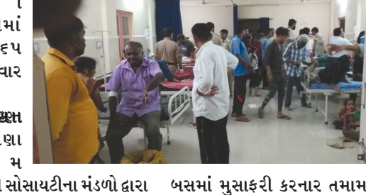
ત્યારે જે માહિતી પ્રાપ્ત થઈ રહી છે તે પ્રમાણે અંબાજીમાં લકઝરીમાં આશરે ૬૫ લોકો સવાર હતા. રેક્સા રામોસણા ગામ નજીકની સોસાયટીના મંડળી દ્વારા સિનિયર સિટીઝન લોકો માટે અંબાજી પ્રવાસનું આયોજન કરવામાં આવ્યું હતું. લકઝરી કરવામાં આવ્યું હતું.

આ અકસ્માતમાં ૨૦ લોકોને ગંભીર ઈજા પહોંચતાં અમદાવાદ સિવિલમાં ખસેડવામાં આવ્યા હતા, તો બાકી ઘાયલ લોકોને મેરાલુ મહેસાણા અને વડનગર ખાતે સારવાર આપવામાં આવી રહી છે.