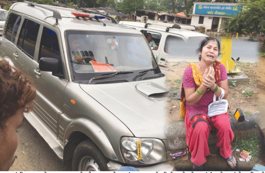
ગાંધીનગર શહેરના ઘ-૭ પાસે સોમવાના રોજ સાંજના સુમારે સીએમ કોન્વોય માં ઉપયોગમાં લેવાતી કારે એક બાઈકને ટક્કર મારી હતી. સામાન્ય ટક્કરમાં બાઈક પર સવાર મહિલાને હાથમાં ઈજા પહોંચી હતી. ગાડી કોન્વોયમાં સામેલ ન હતી તે સમયે અકસ્માત સર્જાયો હતો. જો કે બનાવ અંગે મોડીસાંજ સુધી કોઈ ફરિયાદ નોંધાઈ નથી. અકસ્માતને પગલે થોડીવાર માટે ટ્રાફિકજામ થઈ ગયો હતો.

કર્મચારીઓ હતા. તમામ પૈસાની લેતી-દેતીના હિસાબ માટે તેઓને એક હોટલના રૂમમાં બોલાવવામાં આક્ષેપ અરજદારે કર્યો છે. તે સમયે ચાર પોલીસ કર્મીઓ અને બે શખ્સ અન્ય બીજા હાજર રહ્યા હતા. જુગારના કુલ રૂ. ૭ લાખના તોડમાં જે સ્થળ પરથી જુગાર ધામ પકડાયું તે ફલેટના માલિક પાસેથી પણ રૂ. ૧૫ હજાર રૂપિયા લીધા હોવાનો પણ સમાવેશ થાય છે. ત્યારે આ સમગ્ર કેસમાં પીએસઆઈએ દાવો કર્યો છે કે તેમણે કશું ખોટું કર્યું નથી અને રેઈડની જે પણ કાયદાવી કરવામાં આવી છે તે વિડીયો રેકોર્ડિંગ સાથે કરવામાં આવી છે.