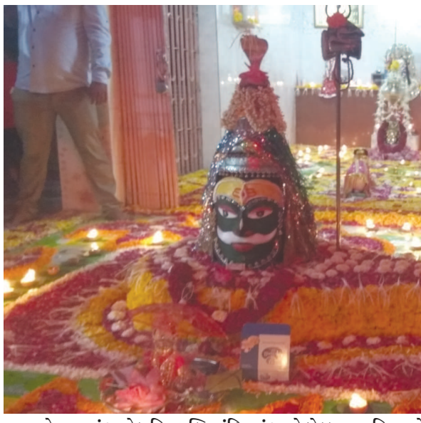
સે. ૨૭માં આવેલ શિવશક્તિ મંદિરમાં આજે છેલ્લા શ્રાવણિયા સોમવારને લઈ ભગવાન મહાકાલ જેવો શ્રૃંગાર કરવામાં આવ્યો હતો તેની તસ્વીર.