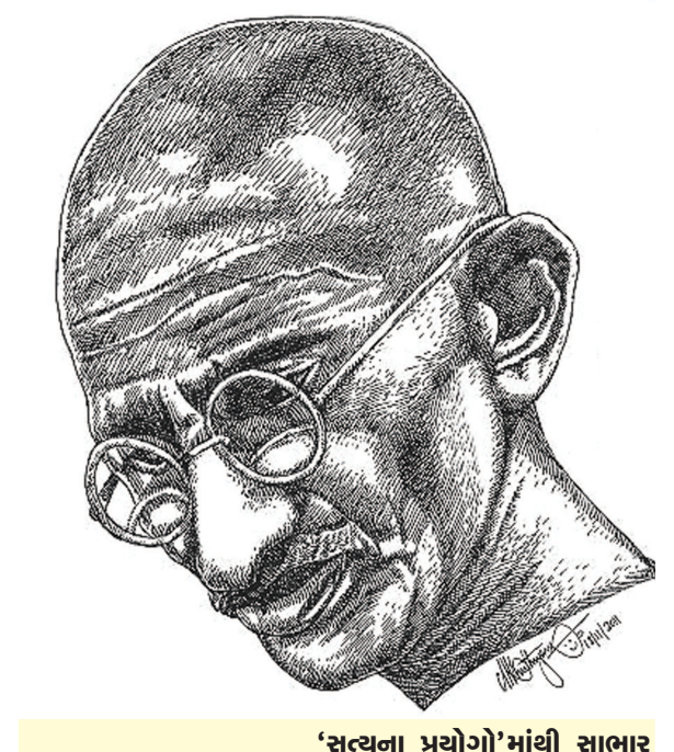
‘સત્યના પ્રયોગો’માંથી સાભાર