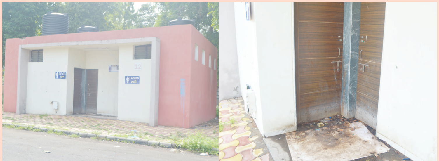
‘જહાં સોચ, વહાં શોચાલય’ આ સુત્ર દ્વારા ભારત સરકારે દેશભરમાં શોચાલયોના નિર્માણનું અભિયાન હાથ ધર્યું હતું જે સફળ રહ્યું હોવાના દાવા પણ કરવામાં આવે છે. ‘જ્યાં વાંચન હોય ત્યાં વિચાર’ એટલે કે ‘સોચ’ વિકસે છે, પરંતુ અફસોસ કે રાજ્યના પાટનગરમાં જ્યાં ‘મધ્યસ્થ ગ્રંથાલય’ આવેલું છે તેની સામે જ વિકસાવાયેલા શોચાલયને ઘણા સમયથી લાગેલા ખંભાતી તાળા ખૂલતાં જ નથી. લાયબ્રેરીમાં અસંખ્ય યુવાનો વાંચન કાર્ય માટે આવે છે તેમજ અહીં યા-નાસ્તાની લારીઓ તથા પાન-મસાલાના ગલ્લાં પણ હોવાથી ઘણા ગ્રાહકોની અવરજવર રહે છે, જેઓને લઘુશંકા માટે પણ ‘શોચાલય’ ખુલ્લું મળતું નથી છેવટે તેના કરવાજે ‘કામ’ પતાવી જતા રહે છે જેથી ગંદકીના થર જામ્યાં છે જે વાંચનાલયના વાચકો તથા કર્મચારીઓ માટે રોગચાળાનો ખતરો પેદા કરી રહ્યા છે.

ગાંધીનગર, તા. ૨૮ ગાંધીનગર રાંદેસણ નજીક આવેલા ઉર્જનગર વિભાગ-૨ ખાતે રહેતો એક પરિવાર કામઅર્થે બહારગામ ગયો હતો. તે સમયે તેમના બંધ મકાનને તરફરોએ નિશાન બનાવ્યું હતું. તરફરોએ ઘરમાં ચુરી હતી. તે સમયે તેમના ઘરમાં ફરી દીધો હતો. ઘરે પરત ફરેલા પરિવારે જોયું તો ઘરનું તાળુ તુટેલું હતું અને ઘરનો દરવાજો ખુલ્લો હતો. જેથી પરિવારે તાત્કાલિક પોલીસને જાણ કરતા ઈન્ફોર્સીટી પોલીસ બનાવ સ્થળે પહોંચી ગઈ હતી અને તપાસ હાથ ધરી હતી. જો કે મકાન માલિકે ઘરમાં તપાસ કરતા ઘરમાંથી માત્ર એક હજાર રૂપિયાની મત્તાનો સામાન ગયો હતો. જેથી પરિવારના સભ્યોએ પોલીસ ફરીયાદ કરવાનું ટાળ્યું હતું. પરંતુ પોલીસે જાણવાજોગ અરજી લઈને તપાસ શરૂ કરી છે.