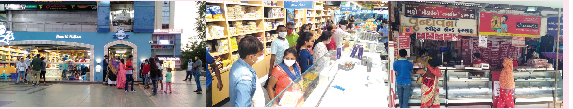
સંબંધની મિઠાશ - રક્ષાબંધન પર્વની પૂર્વ સંધ્યાએ ભાઈનું મો-મીઠું કરાવવા બહેનો મોટી સંખ્યામાં મિઠાઈ અને ચોકલેટ ભરીદેવા શહેરની મિઠાઈની દુકાનો પર ઉમટી હતી... કોરોનાના ભય વચ્ચે પણ પર્વનો ઉમેગ છલકાઈ રહ્યો છે. ક્યાંક સામાજિક અંતર જાળવીને અંતરની લાગણીઓ અભિવ્યક્ત કરવા પ્રતિક્રમિક મિઠાઈ ભરીદેતી બહેનોની તસવીર...