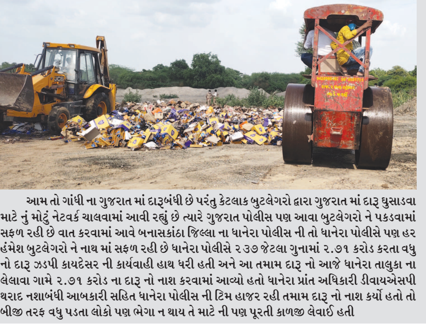
આમ તો ગાંધી ના ગુજરાત માં દારૂબંધી છે પરંતુ કેટલાક બુલડોઝરો દ્વારા ગુજરાત માં દારૂ ઘુસાડવા માટે નું મોટું નેટવર્ક ચાલવામાં આવી રહ્યું છે ત્યારે ગુજરાત પોલીસ પણ આવા બુલડોઝરો ને પકડવામાં સફળ રહી છે વાત કરવામાં આવે બનાસકાંઠા જિલ્લા ના ધાનેરા પોલીસ ની તો ધાનેરા પોલીસે પણ હર હંમેશ બુલડોઝરો ને નાથ માં સફળ રહી છે ધાનેરા પોલીસે ૨૩૭ જેટલા ગુનામાં ૨.૭૧ કરોડ કરતા વધુ નો દારૂ ઝડપી કાયદેસર ની કાર્યવાહી હાથ ધરી હતી અને આ તમામ દારૂ નો આજે ધાનેરા તાલુકા ના લેલાવા ગામે ૨.૭૧ કરોડ ના દારૂ નો નાશ કરવામાં આવ્યો હતો ધાનેરા પ્રાંત અધિકારી ડીવાયએસપી થરાદ નશાબંધી આબકારી સહિત ધાનેરા પોલીસ ની ટિમ હાજર રહી તમામ દારૂ નો નાશ કર્યો હતો તો બીજી તરફ વધુ પડતા લોકો પણ ભેગા ન થાય તે માટે ની પણ પૂરતી કાળજી લેવાઈ હતી