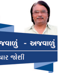
અજવાણું - અજવાણું તુષાર જોઈશી