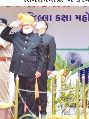
ગાંધીનગર જિલ્લા પંચાયત ખાતે દવ્યવંદનની ઉજવણી

વ્યથાની એક સુંદર અને કોરોના સમય માટે અસરકારક વાત કરી હતી, જેણે અહીં સૌને ભાવુક કર્યા હતા. ખૂબ જ રસપ્રદ અને સાંભળવી ગમે એવી અસરકારક વાત હતી. આજના કોરોના સંક્રમણ વચ્ચે લોકોને બચાવવા ડોક્ટરો, નર્સ અને સ્ટાફ તેમજ તમમામ સરકારી કર્મચારી જે રીતે દર્દીઓને બચાવવા કામે લાગ્યા છે