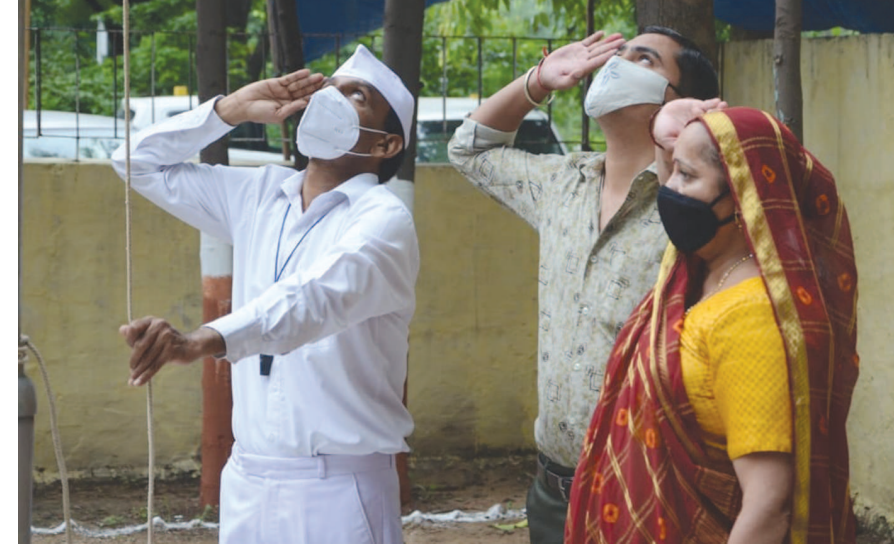
ગાંધીનગર જિલ્લા પંચાયત ખાતે દવ્યવંદનની ઉજવણી

બાયડ, તા. ૧૬ બાયડ તાલુકામાં આજરોજ કોરોનાની મહામારી ચાલી રહી છે જેમાં મંડપ એસોસિએશન તરફથી આજરોજ એંદાજે ૨૦૦૦ માર્કનું વિતરણ કર્યું, તેમાં કારોબારી સભ્ય, પ્રમુખ, ઉપપ્રમુખ તથા બધા જ સભ્ય હાજર રહીને મફત માર્કનું વિતરણ કર્યું હતું.