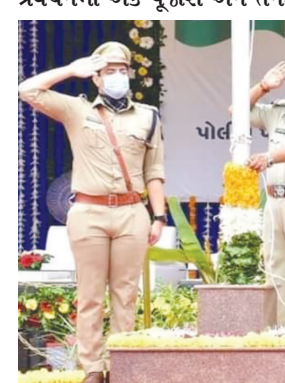
ગાંધીનગર જિલ્લા પંચાયત ખાતે દવ્યવંદનની ઉજવણી

યકાવે, આરતી કરે. બધું જ વ્યવસ્થિત, નિત્ય કમ ચાલતો હતો અને આજે મારા ભગવાન અચાનક ક્યાં ગયા! પૂજારીની આંખમાં આંસુ આવ્યા. ૨૩તી આંખે પ્રાર્થના કરવા લાગ્યો, ત્યારે એકાએક આકાશવાણી થઈ.