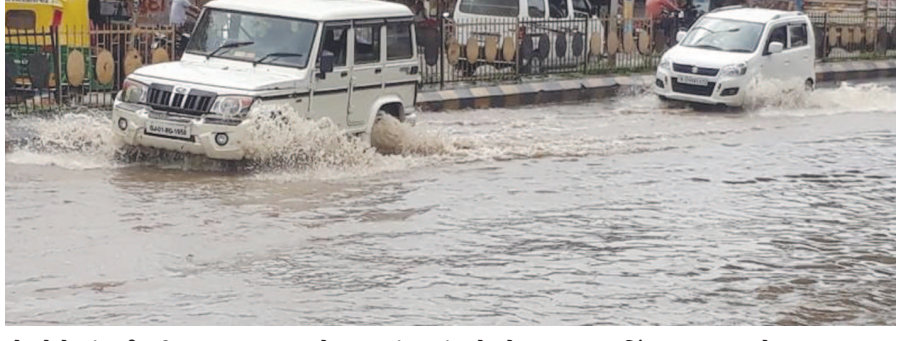
એટલે કે પાંચ ઈંચથી વધુ વરસાદ ખાબકતા આ વિસ્તારમાંથી પસાર થતી નાની નદીઓ તથા નાળાઓમાં નવા પાણીની આવક શરૂ થઈ ગઈ છે. તેજ પ્રમાણે જિલ્લાના ઈંડર અને પોશીના પંથકમાં પણ ત્રણ ઈંચથી વધુ વરસાદ થયાના અહેવાલ સાંપડી રહ્યા છે. જોકે પ્રાંતિજ તલોદ અને હિંમતનગર

હિંમતનગર, તા. ૨૨ સાબરકાંઠા જિલ્લામાં છેલ્લા ૨૪ કલાક દરમિયાન મેઘરાજાએ મહેરબાન થઈને જિલ્લાના કેટલાક વિસ્તારોને વરસાદી પાણીથી તરબતર કરી દીધા છે. જે મુજબ શુક્રવારે સાંજે છ વાગ્યાથી શનિવારે સાંજે ચાર વાગ્યા સુધીમાં ખેડબ્રહ્મા તાલુકામાં અંદાજે ૧૨૮ મી.મી. તાલુકો વરસાદથી વંચિત રહ્યો હોય તેમ સામાન્ય વરસાદ પડ્યો છે. ડીઝાસ્ટર વિભાગના જણાવવા મુજબ શુક્રવારે રાત્રે ઈંડરમાં ૬૩, ખેડબ્રહ્મામાં ૫૮, તલોદમાં ૧૦, પ્રાંતિજમાં ૦૨, હિંમતનગરમાં ૦૬ અને વિજયનગરમાં ફક્ત ૦૧ મી.મી. વરસાદ પડ્યો હતો. ઈંડર અને બીજી તરફ શનિવારે સવારે છ થી સાંજે ચાર વાગ્યા સુધીમાં કુલ મળી ઈંડરમાં ૮૭, ખેડબ્રહ્મામાં ૧૨૮, તલોદમાં ૨૦, પ્રાંતિજમાં ૧૪, પોશીનામાં ૨૬, વડાલીમાં ૭૮ જ્યારે હિંમતનગરમાં ૧૦ અને વિજયનગરમાં હળવો વરસાદ કહી શકાય તેમ ફક્ત ૧૩ મી.મી. વરસાદ થયો છે. શનિવારે આખો દિવસ