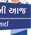
અતિતની આજ ડો. હરિ દેસાઈ

અને નાગા ફેડરલ આર્મીની રચના કરી હતી. ભારત સરકારે લશ્કર પાઠવેલને બળવાખોરોને કચડી નાંખવા ઉપરાંત લશ્કરી ઇળાને વિરોધ અધિકાર આપતા કાયદાનો અમલ કરાવ્યો એટલે લશ્કરી અત્યાચારોની ફરિયાદો ઊઠવા માંડી. દરમિયાન, આસામના રાજ્યપાલ અકબર હૈદરીએ ૨૯ જૂન ૧૯૪૭ના રોજ નાગાઓના મવાળ જૂથના નેતાઓ ટી.સાપીરે અને અલીબા ઈમ્તી સાથે નવ મુદ્દાના કરાર કર્યાં, પણ કિંગ્ડોના