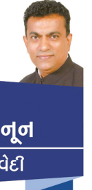
કાયદો અને કાનૂન અધિવેદી

કેસમાં પાંચ જજોની કમીટીએ ચાર વિરૂધ્ધ એકથી યુકાદો પસાર કરી આધારને બેન્ક અને મોબાઈલ સેવામાં મરજિયાત કરતો યુકાદો આપી આધારને માન્ય ગણતો હુકમ આપેલ છે. વ્યક્તિની માહિતીનો ત્રાહિત પાર્ટી, ખાનગી વેબસાઇટ દૂર ઉપયોગ થવાની ૧૦૦ ટકા ખાતરી હોવા છતાં જનતાના અધિકાર ઉપર બંધારણની કલમ ૧૪ ના ભંગ સમાન હુકમ આપેલ છે તેમજ પ્રાચર્ય સેવા એ છે કે જે બેન્ક ખાતા આધાર કાર્ડથી લીક કરેલ છે તે બેન્કો અનલિક્ડ કરી શકશે? જે મોબાઈલ કંપનીઓએ ગ્રાહકોના ડેટા સેલ કરેલ છે તે ડિલીટ કરશે કે પ્રાઈવેટ કંપનીને ડેટા વેચશે? ઈન્ટરનેટ ઉપર વિવિધ સેવાઓ આપતી કંપનીઓ તેના ગ્રાહકોના અધિકારનો છંડેચોક ભંગ કરે છે પરંતુ ગ્રાહકોને તેના અધિકારનો ભંગ થયાની ઘણી જ મોડી ખબર પડતા આવી કંપનીઓ ઉપર પગલા ભરી શકતા નથી. આધાર કાર્ડનો બે વાતમાં વિરોધ જનતાએ નોંધાવેલ એક પ્રશ્નોત્ક્રાંતાના અધિકાર અને બીજો સરકારે ખરડાને મનીબીલ તરીકે પસાર કરી ખોટો ઉપયોગ કર્યો. ગયા વર્ષે સુપ્રીમ કોર્ટે નવ ન્યાયાધીશની બેચે નિજાતને અધિકારનો મુળભુત અધિકાર ગણી યુકાદો આપેલ જે