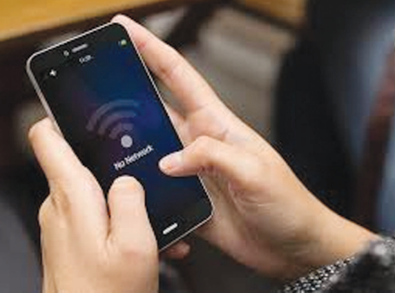
વેચાણ સુધી ધંધાથી લઈને નોકરી સુધી અને શાળા થી નગરજનોએ પોતાના ઘરમાં બ્રોડબેન્ડ સર્વિસ શરૂ કરાવી

તો નાનું બાળક ઓનલાઇન શિક્ષણ લે છે તેના માતા કે પિતા અથવા તો બંને ઓનલાઇન ઓફિસનું કામ કરે છે. આ ઉપરાંત ઘરના વડીલો ઘરની બહાર કોરોનાને કારણે જવાનું નહોવાથી ભક્તિ ગીતો અથવા તો વોટ્સએપ જીવી એપ્લિકેશનનો ઉપયોગ કરતા રહે છે. એટલે કે લોક ડાઉન પહેલાં મહિનાના ઈન્ટરનેટ યુઝર્સ કરતા હાલના દિવસોમાં ઈન્ટરનેટનો ઉપયોગ કરતા નગરજનોનું પ્રમાણ વધ્યું છે. હવે જોવું રહ્યું કે, બ્રોડબેન્ડનું નેટવર્ક અને શહેરીજનો દ્વારા ઈન્ટરનેટનો ડડપી ઉપયોગ કરવાની ઈચ્છા પૂરી થશે કે નહીં?