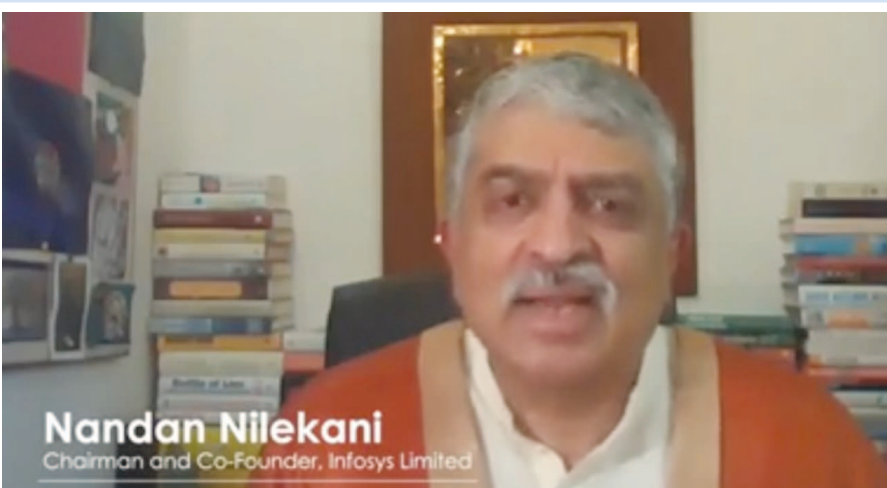
Nandan Nilekani Chairman and Co-Founder, Infosys Limited

ગાંધીનગર, તા. ૨૪ ગાંધીનગરના પાલજ ખાતે સ્થિત ઈન્ડિયન ઈન્સ્ટિટ્યુટ ઓફ ટેકનોલોજી-આઈઆઈટીનો નવમો પદવીદાન સમારોહ ઓનલાઇન યોજાઈ ગયો. કોરોના મહામારીના કારણે વચ્ચુંઅલી યોજવામાં આવેલા આ સમારોહમાં ઈન્ફોસિસના સહ સ્થાપક નંદન નિલકેણીએ ઉપસ્થિત રહી વિદ્યાર્થીઓ સમક્ષ જીવનમાં શિક્ષણ પ્રાપ્તિ માટેની સફરને વર્ણવી તેમને પ્રોત્સાહિત કર્યાં હતા.