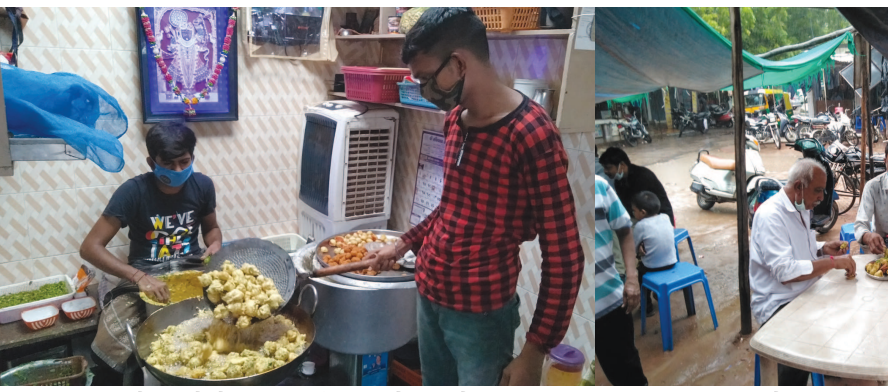
અધીરા બન્યા છે. જાણે કે આ રસિયા શહેરીજનો આ ઋતુમાં યટાકોર દાળવડા અને મેથીના જયાં દાળવડા-ગોટા-ભજીયા મળી રહ્યા છે તે લારીઓથી છે. સતત વરસાદી માોલના કારણે સાચિવાલય સહિત

સરકારી કચેરીઓમાં પણ સહકર્મચારીઓ કામનો બોજો ભુલાવીને ઓફિસમાં દાળવડા-ગોટા મંગાવી સમૂહ મિજબાની માણી રહ્યા છે. એ જ રીતે ખાનગી વેપારીઓ કચેરીમાં પણ આ પ્રકારની માંગ વધેલી અનુભવાઈ રહી છે. યુવા દોસ્તો એકબીજાને મોબાઇલ પર વાત કરીને ભજીયા પાર્ટી એન્જોય કરવા નિશ્ચિત સ્થળે એકઠા થઈ રહ્યા છે. અને સાથે તીખા તમતમતા મરચાં ખાઈને સિસકારીઓ બોલાવી રહ્યા છે. આ સીઝનમાં તો શહેરીજનોના ઘરમાંથી પણ દાળવડા-ભજીયા તળવાની પુશુપ્રસરી રહી છે.