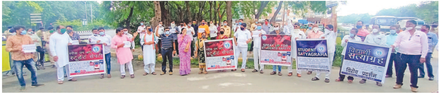
કોરોના મહામારીમાં એક તરફ કેસો સતત વધી રહ્યાં છે અને બીજી તરફ સરકાર દ્વારા શાળા-કોલેજો શરૂ કરવા અંગે નિર્ણય લઈ શકાતો નથી. મોટા ભાગના વાલીઓ આ પરિસ્થિતિમાં પોતાના સંતાનોને શાળા-કોલેજમાં મોકલવા તૈયાર નથી. આ સ્થિતિમાં સરકાર દ્વારા જેઈઈ અને નીટની પરીક્ષાઓનું આયોજન કરવામાં આવ્યું છે. જે મામલે દેશભરમાં રાજનીતિ ગરમાઈ છે અને કોંગ્રેસ દ્વારા પરીક્ષા મુલતવી રાખવા માંગ કરવામાં આવી રહી છે. ગાંધીનગરમાં સે. ૬ સત્યાગ્રહ ઇલાજી ખાતે કોંગ્રેસી અગ્રણીઓ અને કાર્યકરોએ વિરોધ પ્રદર્શન કર્યું હતું.