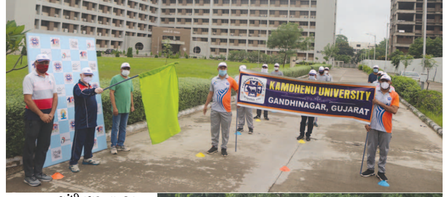
ગાંધીનગર, તા. ૨૯