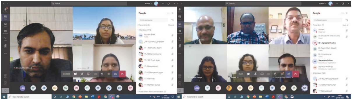
શાહુ (એડવાઈઝર ગુજકોસ્ટ) એ

શંકારપ્રસાદ સરે અનિચ્છિતતા અને પડકારો વિશે માહિતગાર કર્યા આયોજન કરવામાં આવ્યું હતું જેની થીમ ફાર્મસીના અલગ