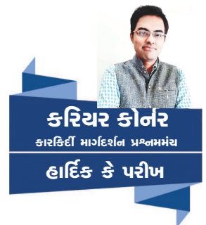
કરિયર કોનર હાર્દિક કે પરીખ

દ્રસ્તીકોણથી માનવનાં આચરણ/વર્તન અંગે જાણકારી આપે છે. માનવ અસ્તિત્વ અને તેનાં આચરણનાં વિવિધ આચારો નો અભ્યાસ કરવા માનવશાસ્ત્રી આ વિષય સંબંધી વિશિષ્ટ શાખાઓમાં આગળ વધે છે. અમુક પ્રાથમિક શાખાઓની વાત કરીએ તો એક છે શરીરિક (બાયોલોજી) માનવશાસ્ત્ર ( ફિઝિકલ એન્થ્રોપોલોજી) જે શારીરિક માનવશાસ્ત્રી એ મનુષ્યને શરીર ધરાવતા સજીવ તરીકે જુએ છે જેની જે વિક