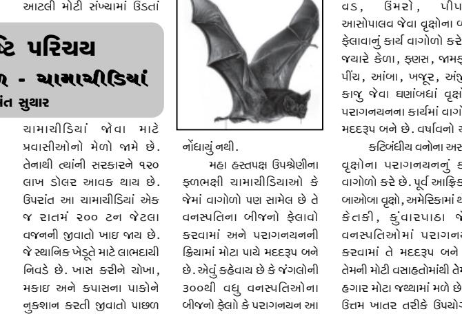
ગાંધાનું બંધી. મહા હત્તપક્ષ ઉપશ્રેણીના ફ્લાઇમી સામાજિકતાકીટાહારી કે જેમાં વાગોળો પછ સામેલ છે તે વનસ્પતિના બીજો ફેલાવો કરવામાં અને પરાગનયનની ક્રિયામાં મોટા પાયે મદદરૂપ બને છે. એવું કહેવાય છે કે જંગલોની ૩૦૦થી વધુ વનસ્પતિઓના બીજો ફેલાવો કે પરાગનયન આ

રીતે લીટલ બ્રાઉન માયોટીસ સામાજિકતાકીટાહારી પક્ષ એક કલાકમાં ૬૦૦ થી ૧૦૦૦ જેટલાં કીટકો ખાય છે. કેટલાકના ઓસ્ટીન ખાતે ફોટેઇલ ઓર્ડ્સ નામના સામાજિકતાકીટાહારી ૨૦૦ લાખથી સંખ્યા ઘરાવતી વિશાળ વસાહત છે. આ જગ્યાએ સામ્રી દરમિયાન આટલી મોટી સંખ્યામાં ઉડતાં કરવો પડતો જંતુનાશક દવાઓનો અર્થ સામાજિકતાકીટાહારીના આ મહત્ત સેવાને કારણે બચે છે. આ એક પ્રકારના જૈવિક નિયંત્રકો છે. આટલી મોટી સંખ્યા હોવા છતાં એક સંશોધન પ્રમાણે છેલ્લા ૩૦ વર્ષમાં સામાજિકતાકીટાહારી ત્યાંના માનવોનો કોઈ નુકશાન થયાનું