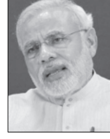
૯૮૮૮ મતો મળ્યા હતા. ૧૯૬૭માં હિતેન્દ્ર દેસાઈ ઓલપાડની બેઠક ઉપરથી