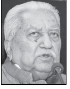
મહેતા (૧૯૬૩) અને ધનશ્યામ ઓઝા (૧૯૭૨) મુખ્યમંત્રી બન્યા હતા અને પછી બેઠક ખાલી