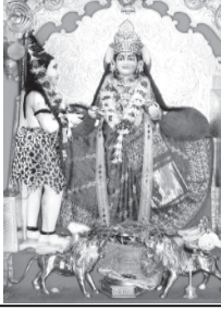
ગાંધીનગર, તા. ૧૧ છેલા સત્યાગ્રહ વર્ષથી અગ્રપૂર્ણા પદયાત્રાનું સફળ આયોજન કરનાર ગાંધીનગર અગ્રપૂર્ણા માતાજી પદયાત્રા સંઘ યાહુ વર્ષે ૨૮મી વર્ષમાં પ્રસ્થાન કરશે.