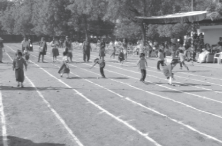
સેન્ટ ઝેવિયર્સ સ્કૂલના વિદ્યાર્થીઓએ રમતોત્સવની શરૂઆત કરાવી હતી.