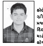
ગુજરાતમાંથી દર વિદ્યાર્થીઓ પસંદ પામ્યા છે.