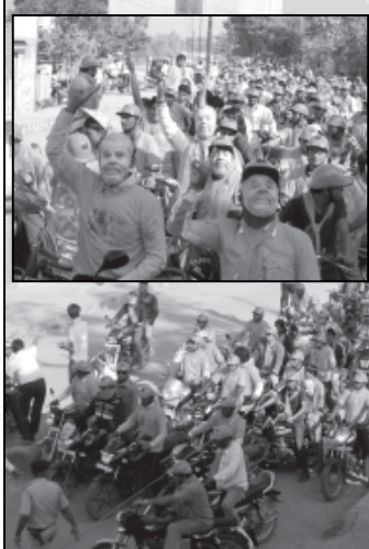
પ્રાંતિજમાં ભાજપની બાઈક રેલી યોજાઈ