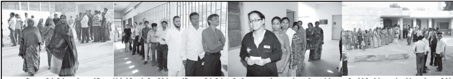
ગુજરાત વિધાનસભાની ચૂંટણીમાં આ વખતે મતદાનનો વિક્રમ સર્જાયો છે, એની આ બોલતી તસવીરો છે. રાજ્યમાં વિધાનસભાની ચૂંટણીમાં અગાઉ ક્યારેય ન થયું હોય એટલા મોટા પ્રમાણમાં મતદાન કરીને ગુજરાતની પ્રજાએ ભલભલા વિશેષણો અને રાજકીય પૂરંધરોને અસમજસમાં મુકી દીધા છે. જીતના દાવા ભલે બધા કરતા હોય, પણ સૌના મનમાં મોટા મતદાનથી ફડકો પેસી ગયો છે. મતદાનનું આ મોટું પ્રમાણ પોતાના તરફી છે કે વિરોધી એ બાબતે સૌ અનિશ્ચિત છે.