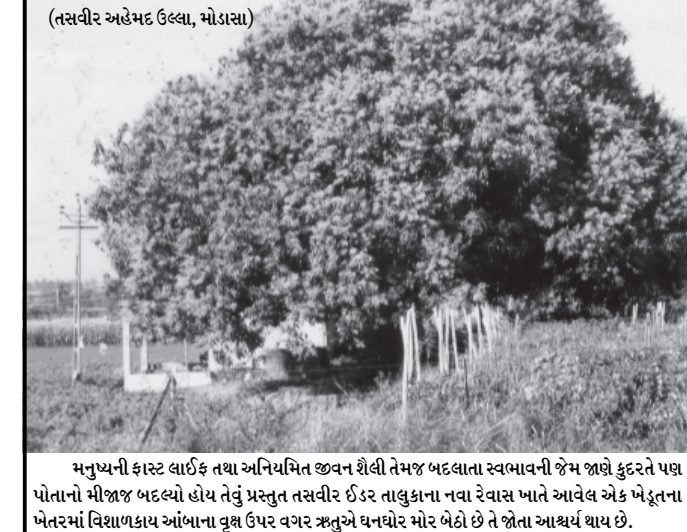
મનુષ્યની ફાસ્ટ લાઈફ તથા અનિયમિત જીવન શૈલી તેમજ બદલાતા સ્વભાવની જેમ જાણે કુદરતે પણ પોતાનો મીજાજ બદલ્યો હોય તેવું પ્રસ્તુત તસવીર ઈડર તાલુકાના નવા રેવાસ ખાતે આવેલ એક ખેડૂતા ખેતરમાં વિશાળકાય આંબાના વૃક્ષ ઉપર વગર ઋતુએ ઘનઘોર મોર બેઠો છે તે જોતા આશ્ચર્ય થાય છે.