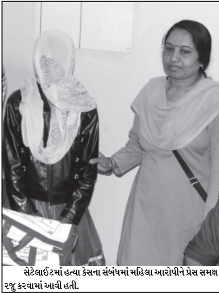
સેટેલાઈટમાં હત્યા કેસના સંબંધમાં મહિલા આરોપીને પ્રેસ સમક્ષ રજૂ કરવામાં આવી હતી.