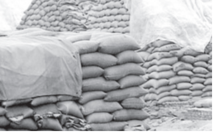
ટોચના પ્રધાનો ઉપસ્થિત રહ્યા હતા. કૃષિ અને નાણાં મંત્રાલય વચ્ચે તાજેતરમાં ભારે વિખવાદ રહ્યા બાદ આ મુદ્દામાં ફરી ધ્યાન આપવાનો નિર્ણય લેવાયો હતો. તેની દરખાસ્તમાં કૃષિ મંત્રાલયે ઘઉંના એમએસડીમાં કિવન્ટલદીઠ રૂપિયા ૧૦૦નો વધારો કરવાનું સુચન કર્યું