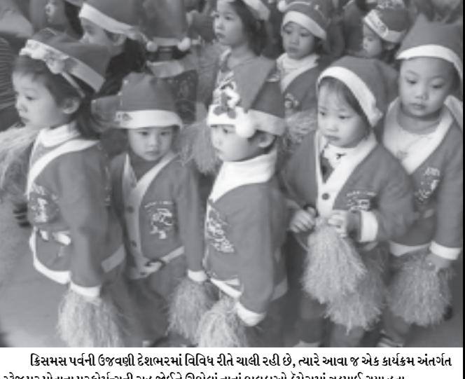
ક્રિસમસ પર્વની ઉજવણી દરમિયાન વિવિધ રીતે ચાલી રહી છે, ત્યારે આવા જ એક કાર્યક્રમ અંતર્ગત સ્ટેજ પર પોતાના પરફોર્મન્સની રાહ જોઈને ઊભેલાં નાનાં બૂલકાઓ કેમેરામાં ઝડપાઈ ગયા હતા.

બેજિંગ અને ગ્વાંગજૂ વચ્ચે શરૂ કરવામાં આવી છે. આનાથી પાટનગરથી દક્ષિણી વાણિજ્ય હબમાં અગાઉ જે ૨૨ કલાકનો સમય લાગતો હતો તેના કરતા ખૂબ ઓછા ગાળામાં પહોંચી શકશે. ચીનના સેન્ટ્રલ ટેલિવિઝન