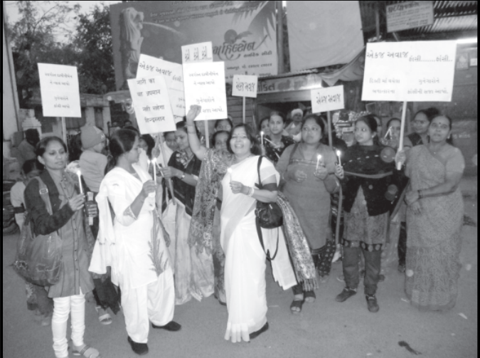
દિલ્હી ગેંગ રેપની પિડીતાનું મોત થતાં પાલનપુરની મહિલાઓએ શ્રધ્ધાંજલી અર્પી બે મિનિટનું મૌન પાળીને કેન્ડલ સળગાવી શ્રધ્ધાંજલી આપી

દિલ્હી ગેંગ રેપનો શિકાર બનેલી ૨૩ વર્ષીય યુવતીનું સિંગાપુરની માઉન્ટ એલિઝાબેથ હોસ્પિટલમાં સારવાર દરમ્યાન જિંદગીના જંગમમાં હારી જઈને તેણીનું મોત નિપજતાં દેશભરમાં ખૂબ જ શરમજનક ઘટના બની હતી. પિડીતાને ન્યાય મળે તે માટે સમગ્ર દેશમાં આકાંક્ષા સાથે દેખાવો પણ થતા જ્યારે તેણીની તબિયત નાજૂક બનતાં તેણીના માટે પ્રાર્થનાઓ, દુઆઓ પણ સમગ્ર દેશમાં કરવામાં આવી હતી. આખરે સતત ૧૨ દિવસથી જિંદગીના જંગ સામે બહાદુરીથી લડનારી યુવતીએ અંતિમ શ્વાસલેતાં તેને શ્રધ્ધાંજલી પણ સમગ્ર દેશમાં અર્પાઈ રહી છે. તેવી જ રીતે પાલનપુર ખાતેના ગુરુનાચક ચોક ખાતે મોટી સંખ્યામાં મહિલાઓ એકઠી થઈને ન્યાય અપાવવા અને દોષિતોને ફાંસીના માંચડે લટકાવવા તેના સંદર્ભે ભારે સૂત્રોચ્ચાર કર્યા હતા અને સમગ્ર મહિલાઓએ કેન્ડલ સળગાવી મૃતકની યાદમાં બે મિનિટનું મૌન પાળીને શ્રધ્ધાંજલી આપી હતી. આ શ્રધ્ધાંજલીમાં મોટી સંખ્યામાં મહિલાઓ એકત્રીત થઈ હતી.