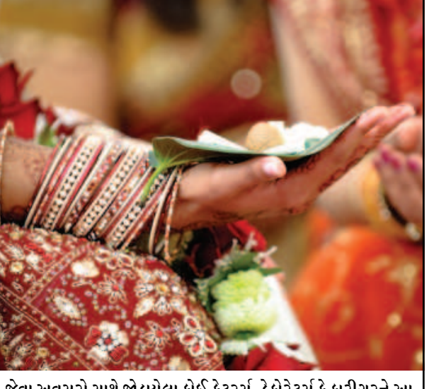
જેવા અવસરો સાથે જોડાયેલા કોઈ કેટરર્સ, ડેકોરેટર્સ કે કારીગરને આ દિવસોમાં ફુરસદ નથી.

૫, ૬ અને ૭ ડિસેમ્બરે ગાંધીનગર આખુ લગ્ન મંડપમાં ફેરવાશે : લગ્નના મુહૂર્ત આ વખતે ખુબ ઓછા હોવાથી રસોઈયા, વેઈટર્સ જેવા કારીગરોની ખુબ ખેંચ ગાંધીનગર, તા. ૩૦ આ વર્ષે લગ્નોના ખુબ ઓછા મુહૂર્ત છે. આગામી ૧૫મીથી કમુરતા બેસી જવાના હોવાથી ડિસેમ્બરના પ્રથમ પખવાડિયામાં લગ્નો ધૂમ છે. તેમાં આગામી તા. ૫, ૬ અને ૭ ડિસેમ્બરના રોજ આખુ ગાંધીનગર લગ્નમંડપમાં ફેરાઈ જાય તેટલા અધધ લગ્નો છે. લગ્નપ્રસંગ કે રીસેપ્શન