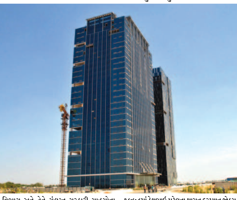
વિભાગ અને તેને સંલગ્ન સરકારી સાહસોના ૧૯૯૮માં કેશુભાઈ પટેલના શાસન દરમિયાન જોડસ ઓફિસરો દિન-રાત ઉજાગરા કરીને વાયબ્રન્ટની

કોઈપણ ૨૧ જ કી ય નેતાના જોડસ શરૂ થાય એટલે સમજી લેવાનું કે તેમનું રાજકીય પતન બહુ નજીકમાં