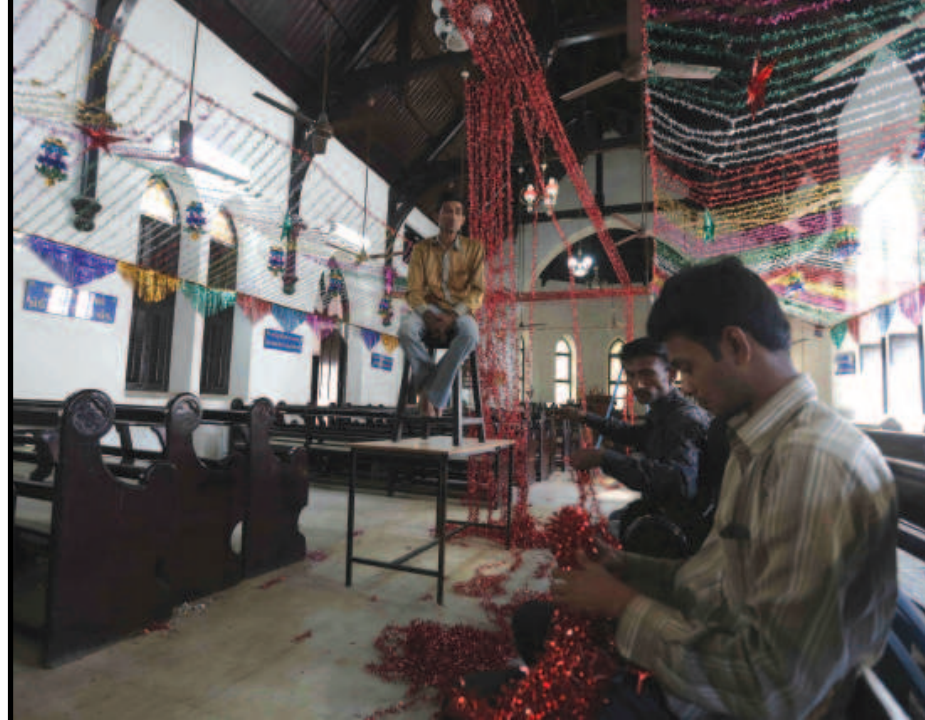
કિસમસની તૈયારી - ખ્રિસ્તી પરિવારોના પર્વ કિસમસ આડે ગણતરીના દિવસો છે ત્યારે ઉજવણીની તૈયારી શરૂ થઈ ગઈ છે. તૈયારીના ભાગરૂપે ચર્ચના ડેકોરેશનની તૈયારીઓ આરંભાઈ છે....

રાજ્યગુરૂએ પણ ખુબ રસપ્રદ પ્રવચન રજૂ કર્યું હતું. આ ચિંતન શિબિરમાં સ્વચ્છ શાળા-સ્વસ્થ શાળા, શાળા નામકન-આર્થિક અને સૈદ્ધિક સમાનતા, શાળા વ્યવસ્થાપન સમિતિના સુદેહીકરણ, કોમ્પ્યુટર અને આધુનિક ટેકનોલોજીનો વર્ગખંડ શિક્ષણમાં ઉપયોગ સહિતના વિષયોને લઈ ચિંતન કરવામાં આવ્યું હતું.