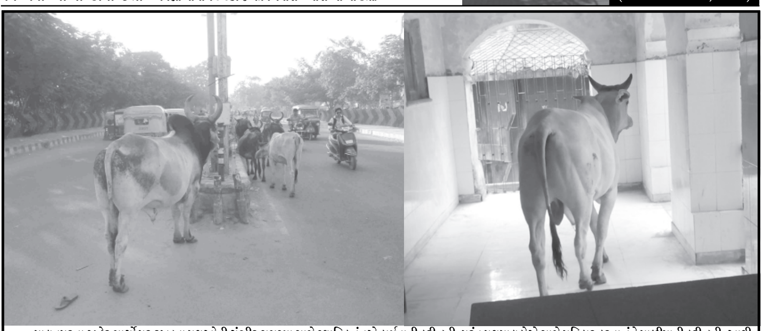
પાલનપુરના જાહેર માર્ગો પર રખડતા પશુઓની ગંભીર સમસ્યા સામે સ્થાનિક તંત્રએ કાર્યવાહી કરી હતી, પરંતુ પશુપાલકોએ સામે પ્રતિકાર કરતા તંત્રે પાછીપાની કરી હતી. આથી પશુપાલકો હવે બમણા જોરથી દાદાગીરી કરવા લાગ્યા છે. હવે તો પાલનપુરની સિવિલ હોસ્પિટલના સંકુલમાં પણ ગાયોએ અડીંગો જમાવી દીધો છે. ગાયો જાણે સારવાર કરાવવા જાને આવી હોય તેમ તબીબની પ્રતિભા કરતી નજરે પડે છે.