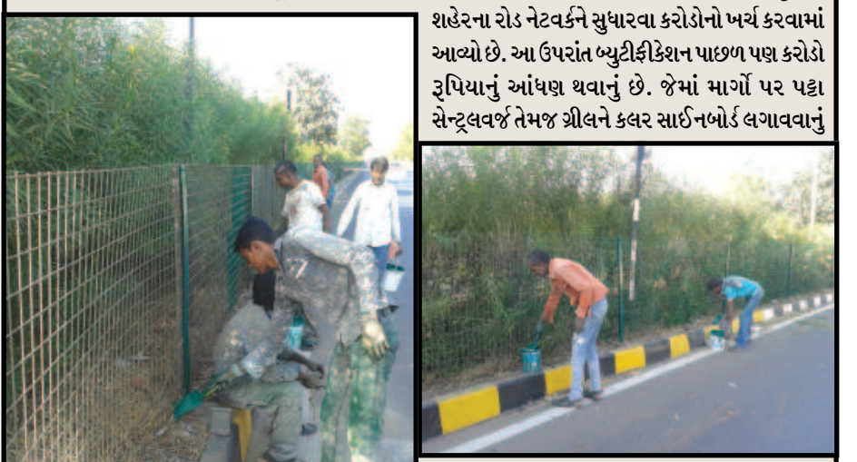
કામ પણ હાથ ધરાશે. ચ-૦થી કોબા માર્ગ ઉપર પણ હાલ સેન્ટ્રલવર્જની ગ્રીલને કલર કરવામાં આવી રહ્યો છે. આ રૂટમાં મહાનુભાવોની અવર જવર વિશેષ થવાની હોવાથી સલામતી ઉપરાંત બ્યુટીફિકેશન પણ જળવાઈ રહે તેનું પણ ધ્યાન કેન્દ્ર કરામાં આવ્યું છે. શહેરમાં પણ સેન્ટ્રલ વર્જના તેમજ ફૂટપાથની સાઈડમાં કલરકામ કરવામાં આવી રહ્યું છે.

ગાંધીનગર, તા. ૫ આગામી વાઈબ્રન્ટ સમિટીની પૂર્વ તૈયારીના દર્શ્યો