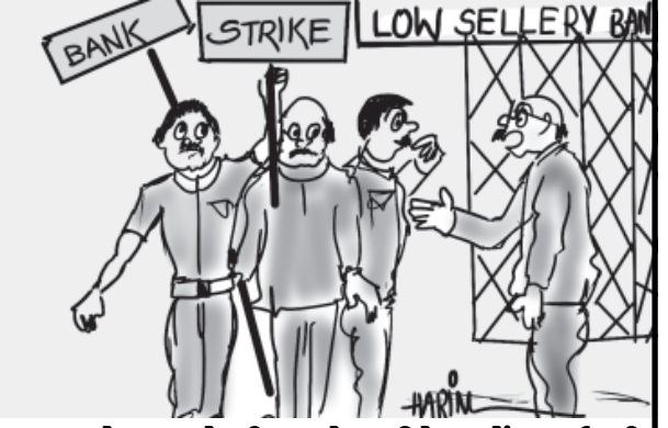
સાહેબ, અમે વીચારએસ લીધેલા બેંક કર્મચારી જ છીએ... આ લોકોની જગ્યાએ અમે કામ કરી દઈએ બોલો...!!