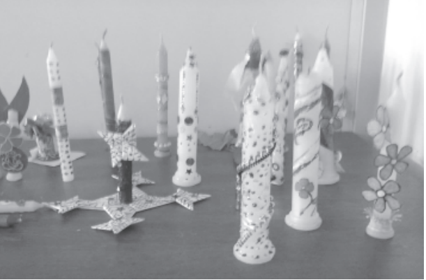
વિદ્યાર્થીઓએ કેન્ડલ ડેકોરેશનમાં ભાગ લઈ પોતાની કલા શક્તિને અભિવ્યક્ત કરી હતી. બાળકોએ મીણબત્તીને સુંદર રીતે શણગારી હતી. જુદા જુદા રંગ અને મટીરીયલ્સ દ્વારા બાળકોએ કેન્ડલને આકર્ષક બનાવી હતી. જેમાં બાળકોની કલ્પનાશક્તિ અને સર્જન શક્તિનું દર્શન થયું હતું. આ ઉપરાંત ધોરણ-૧ થી ૪ના બાળકો માટે ટ્રાફિક સિગ્નલ્સની માહિતી આપતો કાર્યક્રમ યોજવામાં આવ્યો હતો. બાળકોએ સુંદર ચાર્ટ્સ તૈયાર કર્યા હતા. ચાર્ટ્સમાં રંગીન ચિત્રો-સિગ્નલ્સ દર્શાવ્યા હતા. બાળકોને આ અંગે પ્રશ્નોત્તરી કરવામાં આવી હતી જેમાં દરેક વિદ્યાર્થીઓ રસપૂર્વક ભાગ લીધો હતો. વર્ગ શિક્ષકોએ પણ સમગ્ર કાર્યક્રમને સફળ બનાવવા ભારે જહેમત ઉઠાવી હતી. શાળાના આચાર્ય દ્વારા ભાગ લેનાર દરેક વિદ્યાર્થીને અભિનંદન આપવામાં આવ્યા હતા. વિદ્યાર્થીઓની કલા શક્તિને બિરદાવવામાં આવી હતી.