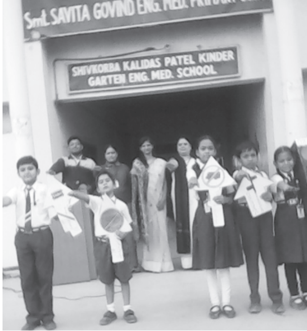
ગાંધીનગર, તા.૬ વિદ્યાર્થીઓ માટે 'ટ્રાફિક સિગ્નલ્સ' ગાંધીનગરની એસ.જી. ની જાણકારી આપતો કાર્યક્રમ યોજાઈ ઈંગ્લિશ મિડિયમ પ્રાયમરી સ્કૂલમાં ગયો. તાજેતરમાં ધો-૫ થી ૮ માટે કેન્ડલ શાળાના આચાર્યના માર્ગદર્શન ડેકોરેશન અને ધો-૧ થી ૪નાં હેઠળ ધોરણ-૫થી ધો-૮ના