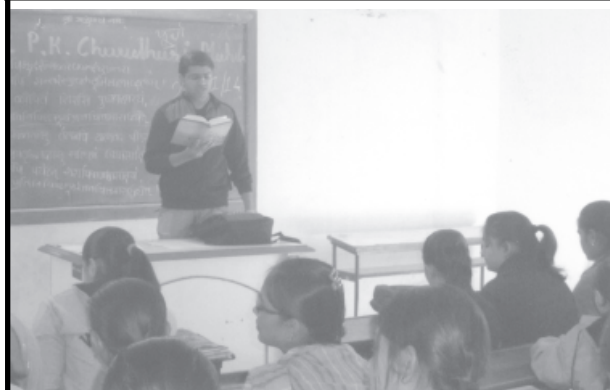
ગાંધીનગર, તા.૬ ગાંધીનગરના સે-૭માં આવેલ પી.કે. યૌધરી મહિલા આર્ટ્સ કોલેજમાં તાજેતરમાં સંસ્કૃત શ્લોક ગાન તાલીમ વર્ગનું આયોજન કરવામાં આવ્યું હતું. આ તાલીમ વર્ગમાં પહેલા વર્ષમાં અભ્યાસ કરતી ૪૪ વિદ્યાર્થીનીઓને યુજરાત યુનિ.માં એમ.ફીલ.ના વિદ્યાર્થી