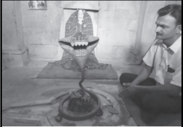
લક્ષ્મીપુરા ગામની સરહદનો વિસ્તાર વિજયનગર તાલુકાના આંતરસુબાની નજીકનો રમણીય, સોહામણો પોળોના નામથી પ્રખ્યાત બનેલો છે. જ્યાં શિવ ભોળાનાથનું પ્રાચિન સ્વયંભુ મંદિર શારણેશ્વર ભગવાનના નામથી સુપ્રસિદ્ધ છે. શિવ ભોળાનાથના આ મંદિરે દર વર્ષની જેમ આ વર્ષે પણ ભવ્ય લોકમેળાનું આયોજન કરવામાં આવ્યું હતું. જેમાં મોટી સંખ્યામાં માનવ મહેરામણ ઉમટ્યું હતું. ભગવાનના દર્શન કરી ધન્યતા અનુભવી હતી.