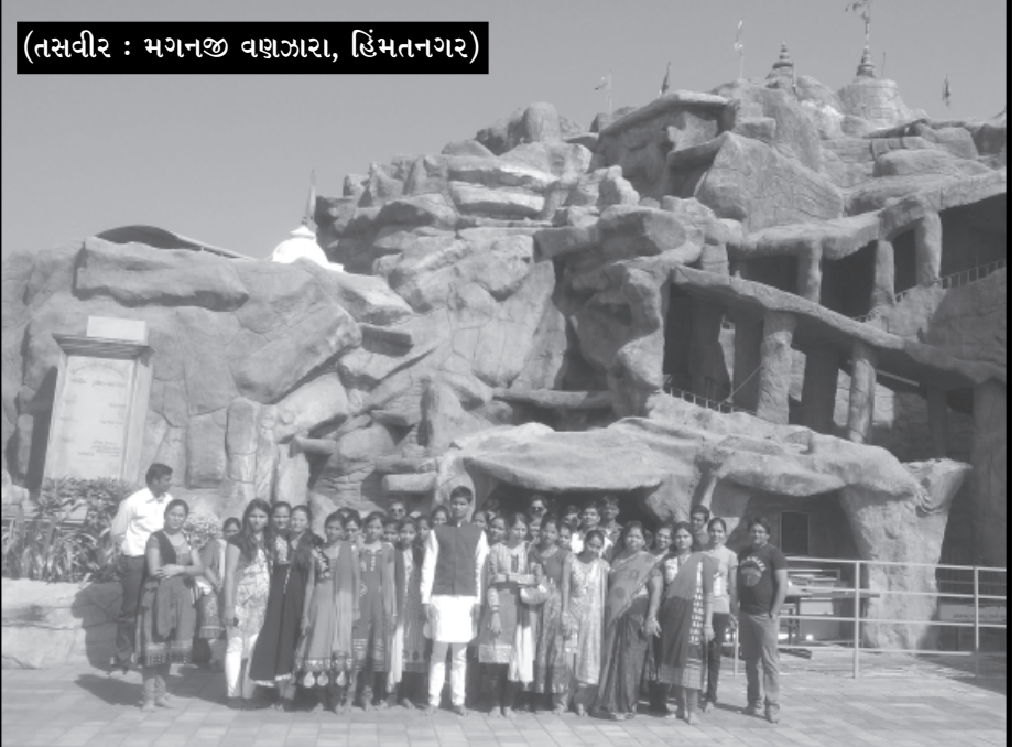
સમર્થ બીએડ કોલેજના તાલીમાર્થીઓનો એક દિવસીય શૈક્ષણિક-વાસ યોજાયો સાબરકાંઠા જિલ્લાના મુખ્ય મથક હિંમતનગરની સાબરડેરી પાસે આવેલ સમર્થ ગ્રુપ ઓફ કોલેજસ સંચાલિત બીએડ કોલેજના તાલીમાર્થીઓનો એક દિવસીય શૈક્ષણિક તાજેતરમાં યોજાયો હતો. જેમાં તાલીમાર્થીઓ અમદાવાદ, ગાંધીનગર સાયન્સ સીટી, ઈન્ડ્રોડા પાર્ક, અક્ષરધામ અને વેષ્ણોદેવી મંદિરની મુલાકાત લઈને સમગ્ર-વાસ દરમિયાન વિજ્ઞાન, અધ્યાત્મિક, કૃતિ સાથે એક દિવસીય પળો ઉત્સાહભરે માણી હતી.