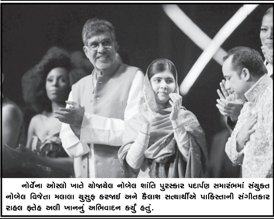
નોર્વેના ઓસ્લો ખાતે ચોખચેલ નોબેલ શાંતિ પુરસ્કાર પદાર્પણ સમારંભમાં સંયુક્ત નોબેલ વિજેતા મલાલા યુસુફઝ કટાબાઈ અને કૈલાશ સત્યાર્થીએ પાકિસ્તાની સંગીતકાર રાહલ ફતેહ અલી ખાનનું અભિવાદન કર્યું હતું.