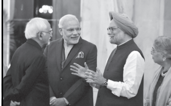
રશિયન પ્રમુખ વ્લામિદર પુટિનના માનમાં ચોખચેલ ભોજન સમારંભમાં ઉપરાષ્ટ્રપતિ હમીદ અન્સારી, વડાપ્રધાન નરેન્દ્ર મોદી અને ભૂતપૂર્વ વડાપ્રધાન મનમોહન સિંઘ ગોષ્ઠિ કરતા નજરે ચડતા હતાં.