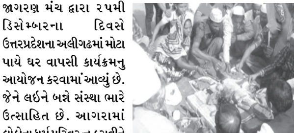
આગામી દિવસોમાં આ કાર્યક્રમ જારી રહેશે. અલીગઢ બાદ ટુંક સમયમાં જ યુપીના અન્ય