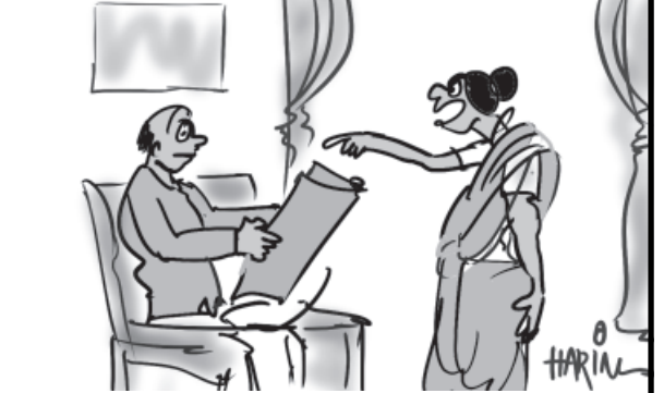
હવે છાપુ મૂકો.. સરકાર હવે વાઇબ્રન્ટ બનાવવા કહે છે... 'વાંચે ગુજરાત' પુસ્તક ગમ્યું...!!