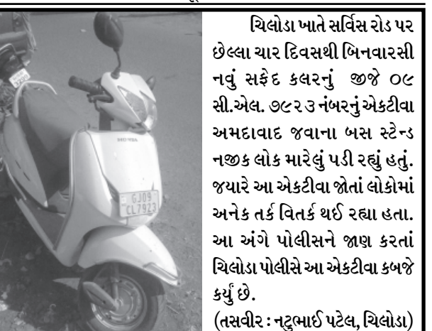
ચિલોડા ખાતે સર્વિસ રોડ પર છેલ્લા ચાર દિવસથી બિનવારસી નવું સફેદ કલરનું જીજી ૦૮ સી.એલ. ૭૮૨ ડે નંબરનું એક્ટીવા અમદાવાદ જવાના બસ સ્ટેન્ડ નજીક લોક મારેલું પડી રહ્યું હતું. જ્યારે આ એક્ટીવા જોતાં લોકોમાં અનેક તર્ક વિતર્ક થઈ રહ્યા હતા. આ અંગે પોલીસને જાણ કરતાં ચિલોડા પોલીસે આ એક્ટીવા કબજે કર્યું છે.

ચાર દિવસીય સંમેલનમાં દેશ વિદેશના ૧ લાખ યુવાનો અને ૨૫ લાખ દર્શનાર્થીઓ ઉમટશે : પૂ. મોરારિબાપુ અને પૂ. રમેશભાઈ ઓઝા સહિત અનેક અગ્રણી સંતો આશીર્વાચન પાઠવશે : વિવિધ પ્રદર્શનોનું આયોજન કરવામાં આવશે