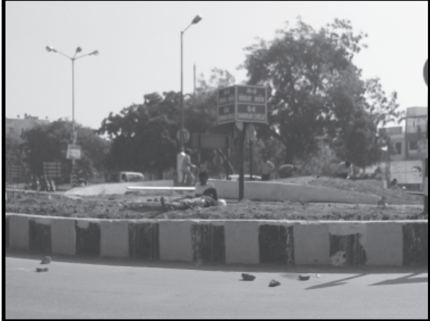
૨૦૧૫માં યોજાનાર વાઈબ્રન્ટ સમિટ અનુસંધાને નગરને ચારેબાજુથી શણગારાઈ રહ્યું છે. દેશ-વિદેશથી જાય તેવો શુભ હેતુ આ કાર્યવાહીમાં રહેલો છે. જે કે છેલ્લા ઘણા વર્ષોથી જે સ્મારકો અને સર્કલો તરફ તંત્ર

તંત્રની ઉપેક્ષાઓનો ભોગ બનેલા આ બે સર્કલની દશા સુધરતાં નામ પ્રમાણે ગુણ પ્રગટ થશે ગાંધીનગર, તા. ૨૨ પધારનાર મહેમાનો રાજ્યની સાફ પાટનગરમાં જાન્યુઆરી- સુથરી છબી પોતાના મનમાં લઈને