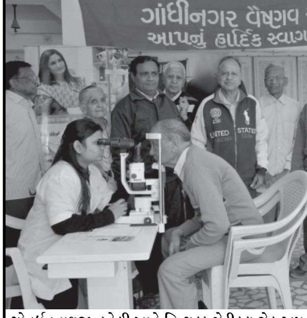
ગોવર્ધનનાથજી હવેલી ખાતે નિ:શુલ્ક મેડીકલ ચેક અપ કેમ્પ યોજાયો