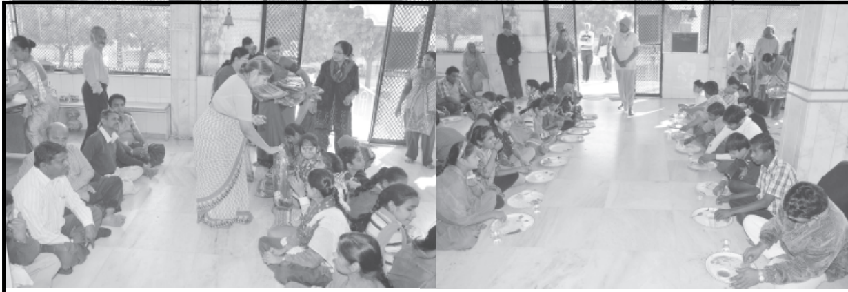
સેક્ટર-૫/એ જય એંબે મંદિર ખાતે વિશિષ્ટ બાળકોને ભોજન પીરસાયું હતું. ટ્રસ્ટ દ્વારા વિવિધ સેવાકીય પ્રવૃત્તિઓ ચાલી રહી છે ત્યારે પીડીતો અને વંચિતો માટે વિવિધ સેવાકાર્યના પ્રકલ્પો યોજાય છે.