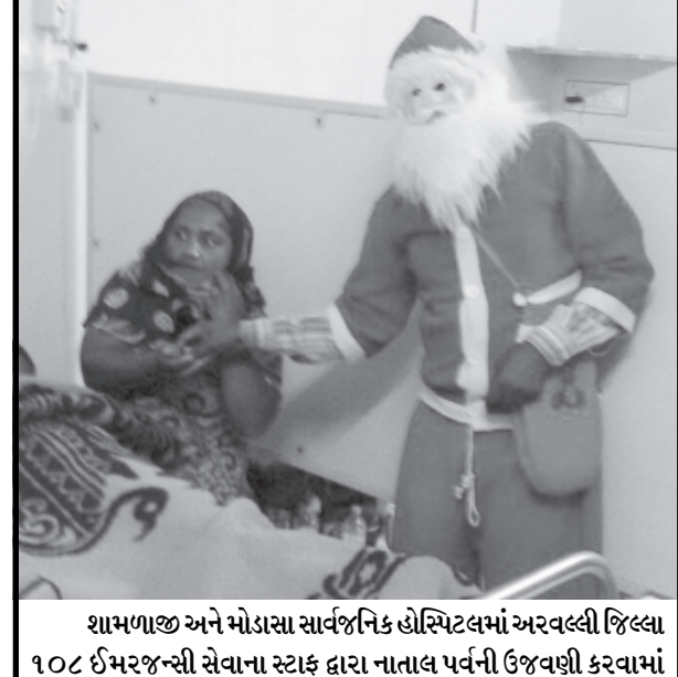
શામળાજી અને મોડાસા સાર્વજનિક હોસ્પિટલમાં અરવલ્લી જિલ્લા ૧૦૮ ઈમરજન્સી સેવાના સ્ટાફ દ્વારા નાતાલ પર્વની ઉજવણી કરવામાં આવી હતી. જેમાં ૧૦૮ ના સભ્યો દ્વારા શાંતાકલોજ બની બાળકોને ગીકડવું વિતરણ કરવામાં આવ્યું હતું.