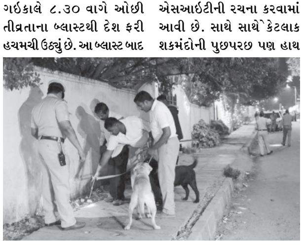
દિલ્હી, મુંબઈ અને કોલકત્તા સહિતના વિસ્તારોમાં એલર્ટની જાહેરાત કરવામાં આવી છે. બીજા બાજુ આ બ્લાસ્ટ મામલે હવે

મળ્યા છે તે દર્શાવે છે કે આમાં સીમીનો હાથ હોઈ શકે છે. ગૃહ મંત્રાલય દ્વારા રવિવારના બ્લાસ્ટના સંદર્ભમાં ચર્ચા કરાઈ છે અને આ બ્લાસ્ટ એવા જ છે જેવા પૂણે અને ચેન્નઈ તથા બીજાં નોરમાં થયા હતા. ફરાર થયેલા સીમીના પાંચ ત્રાસવાદીઓના મુદ્દે પણ ચર્ચા થઈ હતી. જુદી જુદી જગ્યાઓએ જુદી જુદી ટીમો મોકલવામાં આવી હોવાનો દાવો બેંગલોર પોલીસ કમિશનરે કર્યો છે. તપાસ ટીમને ટૂંકમાં સફળતા મળશે. મીડિયા અહેવાલમાં એવો દાવો પણ કરાયો છે કે અમોનીયમ નાઈટ્રેડ અને સાઈપ્રોસનો ઉપયોગ કરાયો હતો. આઈઈડીનો ઉપયોગ આમાં કરાયો છે. અને ઉલ્લેખનીય છે કે,