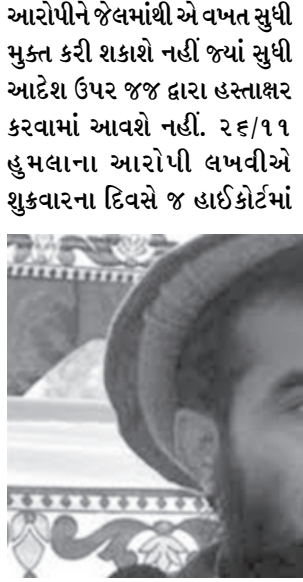
પબ્લિક સિક્યુરિટી ઓર્ડર હેઠળ તેની અટકાયતને પડકાર ફેંકીને અપીલ કરી હતી. અગાઉ પાકિસ્તાન સરકારે મુક્તિ માટેની માંગ કરતી તેની અરજીને ફગાવી દીધી હતી. દરમિયાન મુંબઈ હુમલાના

આરોપીને જેલમાંથી એ વખત સુધી મુક્ત કરી શકાશે નહીં જ્યાં સુધી આદેશ ઉપર જજ દ્વારા હસ્તાક્ષર કરવામાં આવશે નહીં. ૨૬/૧૧ હુમલાના આરોપી લખવીએ શુક્રવારના દિવસે જ હાઈકોર્ટમાં આરોપીને લઈ નારાજ ભારતે જોરદાર વાંધો ઉઠાવ્યો હતો. પાકિસ્તાન મુંબઈ હુમલાના અપરાધીઓ સામે ચાલી રહેલી ટ્રાયલ સામે પણ વાંધો ઉઠાવ્યો છે. પાકિસ્તાનમાં ખૂબ ધીમી ગતિએ