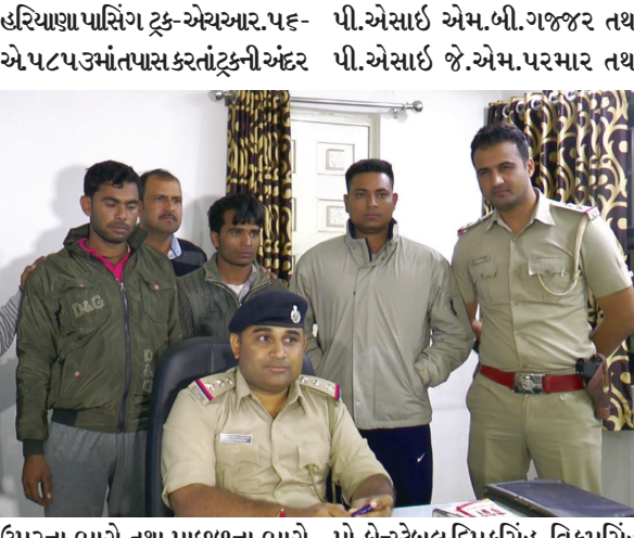
ઉપરના ભાગે તથા પાછળના ભાગે મકાઈના કટ્ટાની થેલીઓની અંદર તથા દલુસિંહ ટીમ દ્વારા ટ્રક પકડી લાકડાંનો વેર ભરી કટ્ટા બનાવવામાં આવ્યાં હતાં અને તેની આડમાં વિદેશી દારૂ રોયલ જનરલ બ્રાન્ડ ૮૦૦ પેટી