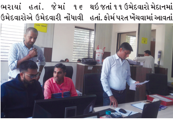
પ્રાંતિજ-તલોદ ૩૩ ઉમેદવારોએ ઉમેદવારી નોંધાવી હતી. જેમાં ૧૬ થઈ જતાં ૧૧ ઉમેદવારો મેદાનમાં હતાં. ફોર્મ પરત ખેંચવામાં આવતાં

પ્રાંતિજ, તા. ૩૦ સાબરકાંઠા જિલ્લાનાં પ્રાંતિજ ખાતે પણ પ્રાંતિજ-તલોદ ૩૩ વિધાનસભાની ઉમેદવારી ફોર્મ પરત ખેંચવાની છેલ્લી તારીખ હોય જેમાં ૧૧ ઉમેદવારોમાંથી ૨ ઉમેદવારોએ ઉમેદવારી પરત ખેંચતા હાલ ૯ ઉમેદવારો વચ્ચે જંગ ખેલાશે તો આવતે પણ ભાજપ-કોંગ્રેસ બંને પક્ષો વચ્ચે સીધો જંગ ખેલાશે. પ્રાંતિજ-તલોદ ૩૩ ઉમેદવારોએ ઉમેદવારી નોંધાવી હતી. જેમાં ૧૬ થઈ જતાં ૧૧ ઉમેદવારો મેદાનમાં હતાં. ફોર્મ પરત ખેંચવામાં આવતાં