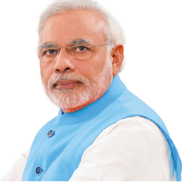
આ રેલીઓમાં ગુજરાતની તમામ રેલીઓને જોડી દેવામાં આવે તો બેવડી સદી ફટકારવા જઈ રહ્યા છે. મોદીએ સૌથી વધારે બહારમાં ૩૧ રેલીઓ કરી હતી. ત્યારબાદ મહારાષ્ટ્ર અને ઉત્તરપ્રદેશમાં ૨૭ અને ૨૪ રેલી કરી છે. આસામમાં ૧૫, ઝારખંડમાં ૧૪, હરિયાણામાં ૧૧, પશ્ચિમ બંગાળમાં ૧૦થી વધુ રેલી કરી ચુક્યા છે. મોદીએ હજુ સુધી જે ૧૭ રાજ્યોમાં ચૂંટણી રેલીઓ યોજી છે તે પૈકી નવ રાજ્યોમાં ભાજપને શાનદાર જીત મળી ચુકી છે. ગુજરાતમાં ઝંઝવતી ચૂંટણી પ્રચાર જારી રાખ્યો છે. ગુજરાતમાં પણ અનેક રેલીઓ કરી ચુક્યા છે. આચારસંહિતા અમલી બન્યા બાદ પણ ૧૦થી વધુ રેલી કરી ચુક્યા છે. ૨૭ અને ૨૮મી નવેમ્બરના દિવસે આઠ રેલી યોજી હતી અને હવે બીજી આઠ રેલી કરી રહ્યા છે. હજુ ઘણી રેલી કરે તેવી પણ શક્યતાઓ છે.

અમદાવાદ, તા. ૩ ૧૭૦થી વધુ રેલી કરી ચુક્યા છે. મોદી ચૂંટણી રેલીને લઈને પણ વડાપ્રધાન નરેન્દ્ર મોદી ગુજરાતમાં પણ આક્રમક ચૂંટણી પ્રચાર કરી રહ્યા છે. ગુજરાતમાં ૧૮૨ વિધાનસભા સીટો માટે નવ અને ૧૪મી ડિસેમ્બરના દિવસે બે તબક્કામાં મતદાન યોજાનાર છે જ્યારે મતગણતરી ૧૮મી ડિસેમ્બરના દિવસે થશે. પ્રથમ તબક્કામાં સૌરાષ્ટ્ર અને દક્ષિણ ગુજરાતની ૮૯ સીટ પર મતદાન થશે.