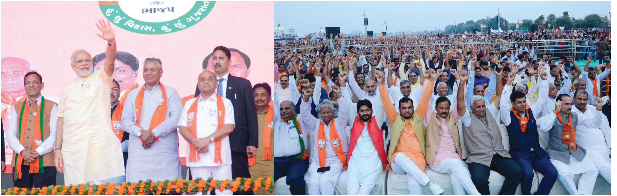
મહેસાણામાં વિકાસ રેલી : ચૂંટણી પ્રચારના અંતિમ તબક્કામાં પ્રધાન મંત્રી નરેન્દ્ર મોદીએ શનિવારે સાંજે મહેસાણા ખાતે જંગી જાહેર સભાને સંબોધી હતી. શ્રી મોદી પોતાની લાક્ષણિક શૈલીમાં કોંગ્રેસના નેતાઓની આકરી ટીકાઓ કરી હતી અને કોંગ્રેસના ખોખલા અને ગેરમાર્ગે દોરનારા વચનોમાં નહીં ભરમાવા અનુરોધ કર્યો હતો. ભાજપની સરકાર રાજ્યમાં અને કેન્દ્રમાં હશે તો વિકાસની ગતિ વધુ તીવ્ર બનશે, એવી વાત કરતા મહેસાણા જિલ્લાના હોવાનું ગૌરવ પણ વ્યક્ત કર્યું હતું. ગુજરાતનો ટીકરો છું, મહેસાણા જિલ્લાનો ટીકરો છું તેવી લાગણીશીલ વાત કરી ભાજપને સમર્થન આપવા અપીલ કરી હતી.