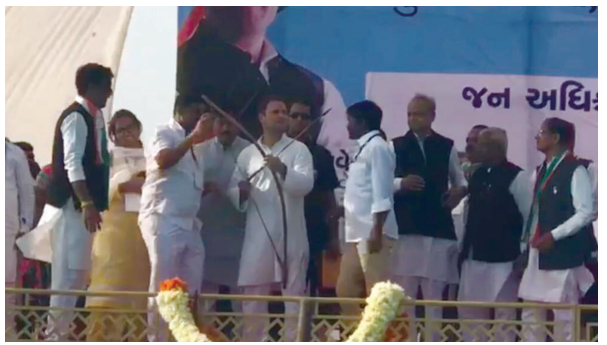
ગાંધીએ રવિવારે અરવલ્લી જિલ્લાના સુપ્રસિદ્ધ યાત્રાસ્થળ શામળાજી નજીક અસાલ ગામના મેદાનમાં જાહેરસભાને સંબોધીને

ભાજપના શાસન, વિકાસની વાત, ગુજરાતના ભવિષ્યની વાતો કરવાને બદલે તેમના જાતના વખાણ કરી રહ્યા છે. બીજી બાજુ કોંગ્રેસ પાર્ટી ભવિષ્યની ચિંતા કરી રહી છે. મતદાન વખતે બટન દબાવતા સમયે નોટબંધી અને જીએસટીને ભૂલતા નહિ તેમ ભારપૂર્વક જણાવ્યું હતું. ગુજરાતે છેલ્લા ત્રણ મહિનાથી પ્યાર જ પ્યાર આપ્યો છે અને હું કોઈ પણ જગ્યાએ હોઈશ તમારા પ્રેમને હું ભૂલીશ નહિ. ગુજરાતના લોકો જ્યારે પણ યાદ કરશે ત્યારે યાદ કરજો હું હોડીથી જઈશ તેમ ભાવુકતાથી જણાવ્યું હતું. રાહુલ ગાંધીએ ખોટા વાયદા