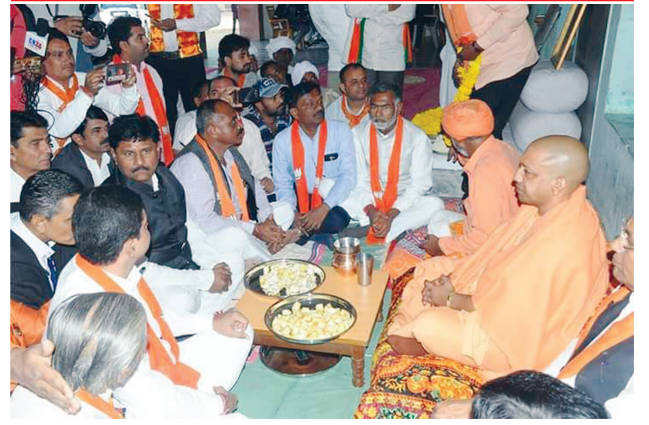
યોગી આદિત્યનાથે જ્વાલીનાથમાં પૂજા કરી

ખેડબ્રહ્મા વિધાનસભા પર પ્રચારના પડઘમ મંગળવાર સાંજે શાંત થઈ ગયા હતા. તેના પહેલા બીજેપી અને કોંગ્રેસ દ્વારા છેલ્લા પ્રયત્ન મુજબ મતદારોને રિજવવા રેલીઓનું આયોજન કરાયું હતું. કોંગ્રેસ દ્વારા ખેડબ્રહ્મા શહેરના વિવિધ માર્ગો પર બાઈકરેલીનું આયોજન કરવામાં આવ્યું હતું. જેમાં તાલુકામાંથી મોટી સંખ્યામાં કાર્યકરો જોડાયા હતા જ્યારે ભારતીય જનતા પાર્ટીએ બસ સ્ટેશન વિસ્તારમાંથી પગપાળા યાત્રા શરૂ કરી ગામ વિસ્તારમાં થઈ સ્ટેશન વિસ્તારમાં પહોંચી હતી. જ્યાં માણેકચોકમાં સભામાં રૂપાંતર થઈ હતી. જ્યાં ધારાસભ્ય દીપસિંહ રાઠોડ, યુપીના મંત્રી મહેન્દ્રસિંહ ભાપણ કર્યું કરી કાર્યકરોને પ્રોત્સાહિત કર્યા હતા. છેલ્લી ઘડીના પ્રચારમાં બંને પાર્ટીઓએ પોતાની શક્તિ પ્રદર્શન કર્યું હોય એવું લાગતું હતું.