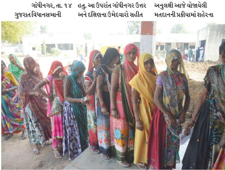
ગાંધીનગર, તા. ૧૪ ડિસેમ્બર. આ ઉપરાંત ગાંધીનગર ઉત્તર ગુજરાત વિધાનસભાની અને દક્ષિણના ઉમેદવારો સહીત અનુલક્ષી આજે યોજાયેલી મતદાનની પ્રક્રિયામાં શહેરના શક્તિસિંહ ગોહીલ અને નિશીત વ્યાસે પણ સે. ૨૦ સ્થિત ચિલ્ડ્રન યુનિવર્સિટીથી મતદાન કર્યું હતું. આ ઉપરાંત શંકરસિંહ વાઘેલાએ પણ પોતાના વાસણ ગામની પ્રાથમિક શાળામાંથી મતાધિકારનો ઉપયોગ કર્યો હતો. ગાંધીનગર ઉત્તરના ભાજપના ઉમેદવાર અશોક પટેલે સે. ૭ પ્રાથમિક શાળામાંથી મતદાન કર્યું હતું.

નરેન્દ્ર મોદીના માતા હીરાબાએ સે. ૨૨ અને રાજ્યપાલે સે. ૨૦ પ્રાથમિક શાળામાં મતાધિકારનો ઉપયોગ કર્યો : સવારે ઠંડીની અસર હળવી થયા બાદ મતદારોનો ઉત્સાહ વધ્યો : વૃદ્ધો માટે વ્હીલચેરની વ્યવસ્થા આશીર્વાદરૂપ નીવડી