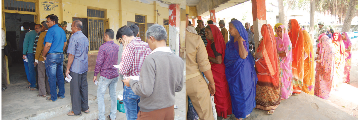
ગ્રામ્ય વિસ્તારોના મતદારોમાં અનેરો ઉત્સાહ જોવા મળ્યો ગાંધીનગર જિલ્લાના ચારેય તાલુકા વિસ્તારોમાં આવેલા ગામડાઓમાં સવારથી જ મતદારોમાં અનેરો ઉત્સાહ જોવા મળ્યો હતો. મોટા ભાગના ગ્રામ્ય વિસ્તારોમાં સવારથી બપોરે ૧૨ વાગ્યા સુધીમાં ૫૦ ટકા મતદાન પુર્ણ થઈ ગયું હોવાના રીપોર્ટ્સ હતા. માણસા અને કલોલ વિસ્તારમાં જિલ્લાનું સૌથી વધુ મતદાન નોંધાયું હોવાના આંકડા છે. જે મતગણતરીના દિવસે પરિણામનો રોમાંચ બમણો કરશે તેમાં બે મત નથી.

મતદાન બાદ સેલ્ફીનો કેલ વિધાનસભાની ચૂંટણીને અનુલક્ષી બીજા તબક્કાના મતદાન દરમિયાન મતદારોમાં ભારે ઉત્સાહ જોવા મળ્યો હતો. યુવાવર્ગમાં ગુપ્તમાં મતદાન કરવા જવાનો ટ્રેન્ડ જોવા મળ્યો હતો. જ્યારે મતદાન માટેની જાગૃતતા અને ઉત્સાહને અનુલક્ષી દિવસ દરમિયાન સોશિયલ મીડીયામાં પણ સતત મેસેજિસ કરતા જોવા મળ્યા હતા. જ્યારે યુવાવર્ગમાં મતદાનના અંતે સેલ્ફીનો કેલ વિશેષ જોવા મળ્યો હતો. મતદાન કર્યા બાદ તુરંત જ સેલ્ફી લઈ ગુપ્તમાં મેસેજિસ કરવાનો ટ્રેન્ડ મજબૂત રહ્યો હતો.