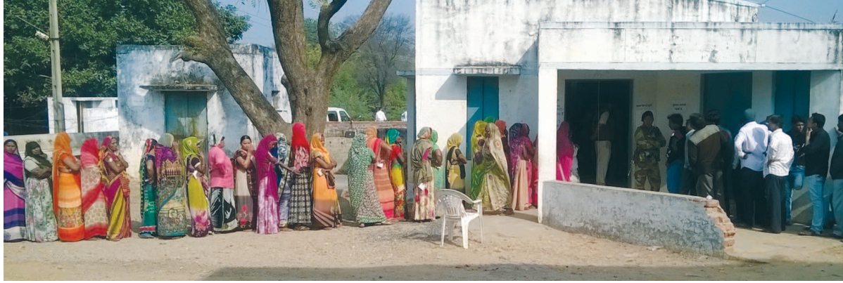
ચિલોડા ખાતે બુથ નં. ૪૮ અને ૫૧માં વધુ મતદારો અને ૪૬ અને ૫૦માં ઓછા મતદારોની સંખ્યાથી મતદારોમાં તફાવત થતા કચવાટની લાગણી દક્ષિણ ગાંધીનગર વિધાનસભાની બેઠક પર ૧૦ ઉમેદવારોએ પોતાનું નસીબ સાથે ઝંપલાવ્યું હતું. આ વિધાનસભાની ચૂંટણીમાં ભાજપ અને કોંગ્રેસ વચ્ચે ખરાબરીનો જંગ ખેલાતાં ચિલોડા મતદાન મથકમાં ૪ બુથ અનુક્રમે બુથ નં. ૪૮માં ૧૧૫૮ મતદારોમાંથી ૮૭૪, બુથ નં. ૪૯માં ૧૦૫૮ મતદારોમાંથી ૭૪૭, બુથ નં. ૫૦-૫૩૮ મતદારોમાંથી ૩૪૭ મતદારો, બુથ નં. ૫૧માંથી ૧૦૫૪ મતદારોમાંથી ૭૮૬ મતદારોએ મતદાન કરતાં કુલ ૩૫૧૮માંથી ૨૫૮૫ મતદારોએ મતદાન કરી પોતાની ફરજ અદા કરી હતી. આમ કુલ ૩૫૧૮માંથી ૨૫૮૫ મતદારોએ મતદાન કરી પોતાની ફરજ અદા કરી હતી. આમ કુલ ૭૩.૫૭ ટકા મતદાન થતાં ઉત્સાહનો માહોલ સર્જાયો હતો. આમ ઉલ્લેખનીય બાબત એ છે કે ૪ બુથમાંથી પ્રથમ અને ચોથા બુથ પર મતદારો અનુક્રમે ૧૧૫૮ અને ૧૦૫૪ મતદારોનો સમાવેશ થયો હતો. જ્યારે બીજા અને ત્રીજા બુથમાં અનુક્રમે ૭૬૭ અને ૫૩૮ મતદારોનો સમાવેશ થયો હતો. પરિણામે પહેલા અને ચોથા બુથમાં વધુ મતદારો અને બીજા અને ત્રીજા બુથમાં ઓછા મતદારોને લીધે પ્રથમ અને ચોથા બુથમાં મતદારોની લાઈન લાંબા સમય સુધી રહેવા પામી હતી. જ્યારે બીજા અને ત્રીજા બુથમાં મતદારોની સંખ્યા ઓછી હોવાથી બપોરે ૧.૩૦ વાગ્યા સુધી મતદારોનો પ્રવાહ ઘટી જવા પામ્યો હતો. જ્યારે બુથ નં. ૪ ૧૦૫૪ મતદારો હોવાથી લાઈન અવિરત ચાલુ રહી હતી. આમ બુથમાં મતદારોની ફાળવણીમાં તફાવત વધુ રહેવાથી મતદારોમાં કચવાટની લાગણી અને રોષ જોવા મળ્યો હતો. આમ છતાં ચિલોડા મતદાન મથકે શાંતિપૂર્ણ મતદાન કરતા મતદારોએ સવારે ૮ થી ૧ વાગ્યા સુધી મતદાન કરવા ઉત્સાહ દર્શાવ્યો હતો.