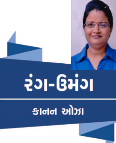
રંગ-ઉમંગા કોલન ઓગા