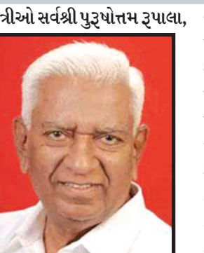
મનસુખ માંડવિયા, સ્મૃતિ ઈરાની ઉપરાંત કર્ણાટકના રાજ્યપાલ વજુભાઈ વાળાના નામો જોરશોરથી ચાલે છે. બુધવારે સાંજ સુધી

વજુભાઈ વાળા સંદર્ભે સોશીયલ મીડિયા પર જોરશોરથી નામ ચલાવાયુ હતુ. મોડી સાંજે કેન્દ્રિય મંત્રી સ્મૃતિ ઈરાનીએ મુખ્યમંત્રીપદના દાવેદાર હોવાનો ઈન્કાર કર્યો હતો. પુરૂષોત્તમ રૂપાલા અને મનસુખ માંડવિયા રાજ્યસભાના સભ્ય હોવાથી હમણાં સંખ્યા ઘટે નહી તેવો મત પ્રવર્તે છે. ત્યારે વજુભાઈ વાળા અને વિજયભાઈ રૂપાણી વચ્ચે જ પસંદગી થશે એમ મનાઈ રહ્યું છે. કેન્દ્રિય પાર્ટીના અંતરંગ વર્તુળોમાંથી મળતી માહિતી મુજબ