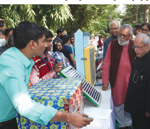
કલામના નામ સાથે જોડાયેલા એક એવોર્ડ સમારંભ કાર્યક્રમમાં પ્રણવ મુખર્જી વિશેષ ઉપસ્થિત રહ્યા હતા. ભારતના ૧૧ માં રાષ્ટ્રપતિ અને આજીવન નવી શો ધોને આવકારનારા ડૉ. એ.પી.જે. અબ્દુલ કલામને યાદ કરતાં પૂર્વ રાષ્ટ્રપતિ પ્રણવ મુખર્જીએ જણાવ્યું કે, વર્ષ-૨૦૦૮થી શરૂ થયેલા ડૉ. એ.પી.જે. અબ્દુલ કલામ ઇન્નાઈટ એવોર્ડ માટે આ વર્ષે યુનિયન ટેરેટરી સહિત દેશભરમાંથી ૬૫ હજાર જેટલા

ગાંધીનગર, તા. ૨૨ દેશના પૂર્વ રાષ્ટ્રપતિ પ્રણવ મુખર્જીએ ગાંધીનગરના મહેમાન બન્યા હતા. ગાંધીનગર નજીક આવેલા પ્રેક્ષા ભારતી ખાતે પૂર્વ રાષ્ટ્રપતિ ડૉ. એ.પી.જે. અબ્દુલ