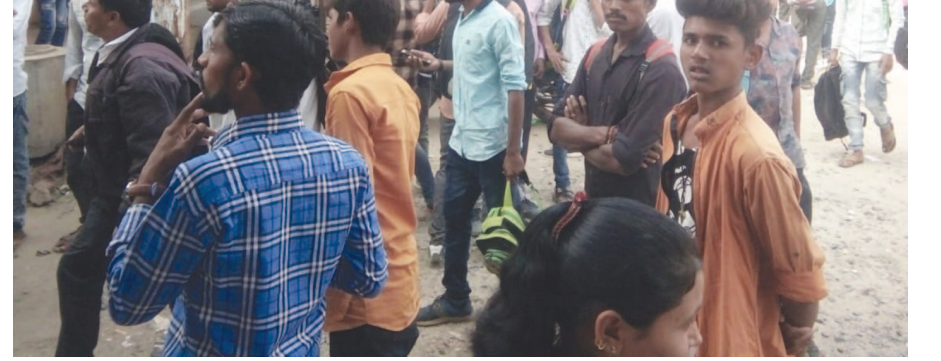
કાંકરેજ, તા. ૨ કાંકરેજ તાલુકાના મુખ્ય મથક શિહોરી એમ.વી. વાલાની હાઈસ્કૂલમાં પોલીસ પરીક્ષા આપવા માટે આવેલા ૬૦૦ પરીક્ષાર્થીઓ પેપર લીક થવાનાં કારણે પરીક્ષા પૂર્ણ કરવામાં આવી હતી. શિહોરીમાં રાજપૂત કેળવણી મંડળ દ્વારા મોબાઈલ અને બેગ મુકવા માટે સુંદર વ્યવસ્થા કરવામાં

જિલ્લામાં પરીક્ષાઓ યોજાય તેવી માંગણી કરી હતી. પોલીસની પરીક્ષા માટે કોનોની જોઈ વિદ્યાર્થીઓ બુશ થઈ ગયા અને પછી પરીક્ષા ખંડમાં પહોંચ્યા ગોરબાપા બોલ્યા પેપર પધરાવો સાવધાન પછી ખબર પડી કે અડધો કલાક પહેલાં પેપર ફૂટી ગયું અને ૧૦૮ દ્વારા ગાંધીનગર ખાતે આવેલા શિક્ષણ વિભાગ પાસે વાલાની હાઈસ્કૂલમાં ૬૦૦ જેટલા પરીક્ષાર્થીઓ પરીક્ષા આપવા માટે આવ્યા હતા ત્યારે વીલા મોઢે પરત ફરતા વાલીઓ અને વિદ્યાર્થીઓ દ્વારા તંત્ર ઉપર અને સરકાર સામે પોતાનો રોષ વ્યક્ત કર્યો હતો. ત્યારે સતત શિક્ષણ વિભાગની લાપરવાહી વિષે અનેકવાર રજૂઆત કરી છે ત્યારે આવી ઘટનાઓ બનતી અટકવાનું