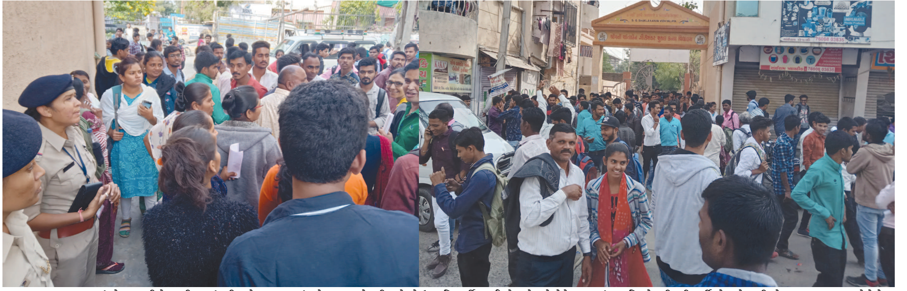
સમગ્ર રાજ્યભરમાં લોકરક્ષકની પેપર લીક થતાં પરીક્ષા કેન્સલ રખાતાં મહેસાણા ખાતે પરીક્ષા કેન્દ્રો ઉપર વિદ્યાર્થી-ભાઈઓ અને બહેનોને સાબરકાંઠાના મિલોડાથી પરીક્ષાર્થીઓ અને વાલીઓ નારાજ થયા હતા. ટોળેટોળા એકઠા થયા હતા.