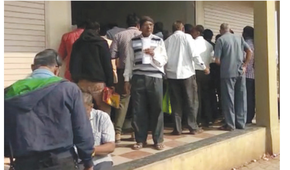
અરવલ્લીમાં ટેકાના ભાવે મગફળી વેચનાર ખેડૂતોને ૧.૫૧ કરોડનું ચુકવણું

ઈલાજ માટે મોકલી આપવામાં આવ્યું છે ત્યારે લાખો પરિક્ષાર્થીને આઘાત લાગ્યો અને વાલીઓ રોષે ભરાયાં સરકાર સામે આશ્પેષ કર્યો કે ચોર ચોરી કરવા જાય એટલે આવા સંજોગોમાં લોકસભાની સૂટછી પહેલા નાટકો ભજવી લોકોને ગેરમાર્ગે દોરવાનું કામ કરે છે. કરોડો રૂપિયાના ખર્ચે વિદ્યાર્થીઓએ પરીક્ષા આપવા માટે ખરચ્યા હવે જવાબદાર કોણ ? આવો ઘાટ ઘડાયો લોકરક્ષક દળની પોલીસ પરીક્ષામાં. શિહોરીની એમ.વી. નામ લેતી નથી આના માટે વિદ્યાર્થીઓનો ભોગ શા માટે લેવાય છે તે પણ એક મોટો યક્ષ પ્રશ્ન છે. ત્યારે કચ્છ, સુરેન્દ્રનગર, હિમતનગર, પાટણ સહિત અન્ય જિલ્લાના વિદ્યાર્થીઓ પોતાના વાલીઓ સાથે શિહોરી પરીક્ષા કેન્દ્રમાં પરીક્ષા આપવા માટે આવ્યા પરંતુ નિરાશાજનક બાબતો ધ્યાનમાં આવી કે બનાસકાંઠા જિલ્લામાં પેપર લીકનો મામલો સમગ્ર દેશમાં ચર્ચાનો વિષય બન્યો હતો અને પરીક્ષામાં બંધાયેલ થયા તેવો ઘાટ સર્જાયો હતો.