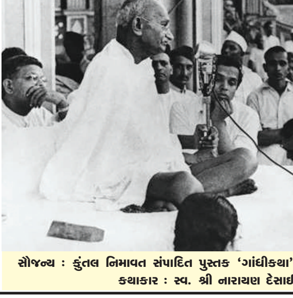
સોજન્ય : કુંતલ નિમાવત સંપાદિત પુસ્તક 'ગાંધીકથા' કથાકાર : સ્વ. શ્રી નારાયણ દેસાઈ

મહાદેવભાઈએ આ પ્રસંગ પોતાની ડાયરીમાં નોંધ્યો છે, જેમાં લખ્યું છે કે ત્યાં ઊભેલા માણસે એમ કહ્યું હતું : 'આ માણસને લીધે હું બેકાર બન્યો, આ માણસને કારણે અમારી મિલો બંધ થઈ ને અમારે કેશ ડાંલ પર રહેવું પડ્યું. પણ તેમ છતાં હું કહું છું કે એની જગ્યાએ હું હોત તો હું પણ એમ જ કરત.' ગાંધીજી એટલી હદે પોતાની વાત તેમને સમજાવી શક્યા હતા. જે અનેક લોકોને ગાંધીજી મળ્યા તેમાં યુનિવર્સિટીના વિદ્વાન હરોલ્ડ લાસ્કીનો પણ સમાવેશ થતો હતો. અનેક જાતની ચર્ચાઓ તેમની સાથે થઈ. જ્યોર્જ બનાર્ડ શો સાથે પણ મુલાકાત થઈ. શો તો પોતાની રમૂજવૃત્તિ માટે જાણીતા એટલે તેમણે તો એમ પણ કહેલું કે જુનિયર મહાત્માને મળવા સિનીયર મહાત્મા આવ્યા છે. આમ કહીને પોતાની જાતને જુનિયર મહાત્મા પણ કહી દીધી. તેમણે તો ગાંધીજીને એમ પણ પૂછેલું, 'આ ગોળમેજી પરિષદમાં તમને કંટાળો નથી આવતો ?' 'કંટાળો શું મને તો ઊંધ આવે છે.' ગાંધીજીએ જવાબ આપ્યો હતો. 'તો પછી આ ગોળમેજી પરિષદમાં શું કામ આવ્યા ?' 'હું પરિષદ માટે થોડા આવ્યો છું ? હું તો તમને લોકોને મળવા આવ્યો છું.' એ પછી એ બંને વચ્ચે પણ અનેક વિષયોની ચર્ચાઓ થઈ. (ક્રમશઃ)