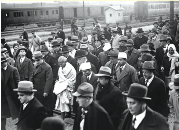
ધનશ્યામદાસ બિરલા કે જેઓ પણ આ ગોળમેજીમાં હાજર હતા તેમણે પોતાના પુસ્તકમાં આ ઘટનાનું વર્ણન કરતાં લખ્યું છે કે વડાપ્રધાન મેકડોનાલ્ડ તો ફટકાટ આંકડા પર આંકડા મૂકવા લાગ્યા : મુસલમાનો પ્રતિનિધિઓએ આજદીની વાતને ટેકો આપ્યો નથી, દલિત પ્રતિનિધિઓ ને દેશી રાજ્યોના પ્રતિનિધિઓએ સ્વરાજની વાતને ટેકો આપ્યો નથી (દેશી રાજ્યોના પ્રતિનિધિઓ તરીકે તો માત્ર રજવાડાઓ જ હાજર રહેલા તેમ છતાં તેની ગણતરી ટકાવારીમાં થઈ રહી હતી), આ સંમત નથી, તે સંમત નથી એમ કરી કુલ ૪૬ ટકા પ્રતિનિધિઓ તો સ્વરાજની વાત સાથે સંમત નથી. લગભગ અડધી સંખ્યા થઈ. મતભલ કે અડધો દેશ સ્વરાજ નથી ઈચ્છતો. હવે જો અડધો દેશ સ્વરાજ ન ઈચ્છતો હોય તો અમારાથી સ્વરાજ કેવી રીતે અપાય ?

ગાંધીજીનો તો ઊંધ પર કાબૂ હતો. ઈસ્ટ એન્ડમાંથી વેસ્ટ એન્ડ પરિષદ માટે જતાં હોય તે દરમિયાન રસ્તો વીસ મિનીટનો, તેમાંથી ૧૯ મિનીટ ગાંધીજી ઊંધી લેતા. પણ મહાદેવભાઈનો તો ઊંધ પર એવો કાબૂ ન હતો. તેથી તેઓ આ ૧૯ મિનીટ દરમિયાન પણ ચર્ચા માટેના મુદ્દાઓ જોઈ જવા વગેરે કામ કરતા. આમ મહાદેવભાઈનું કામ તો ચાલ્યા જ કરતું, જોકે, આ કથા મહાદેવકથા નહીં, પણ ગાંધીકથા છે એટલે એમના વિશે વધુ નહીં કહું, પણ એય ગાંધીકથાનો જ એક ભાગ છે એટલે એના ભાગ તરીકે જેટલું આવે તેટલું કહીશ.