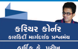
કરિયર કોર્નર કારકિર્દી માંગદારિક પ્રશ્નકોષ્ય હાર્દિક કે. પરીખ

નમસ્કાર. 'કરિયર કોર્નર' કોલમને ખૂબ સારો પ્રતિસાદ મળી રહ્યો છે. અમે આપના સહકારથી અમને ખૂબ પ્રોત્સાહન મળે છે અને અમે વિદ્યાર્થીઓને સચોટ માર્ગદર્શન આપવા કટિબદ્ધ છીએ.