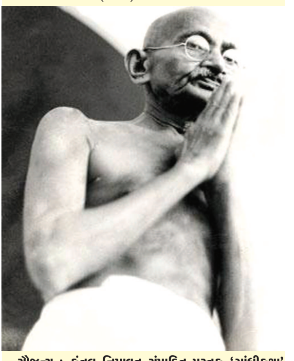
સોજન્ય : કુંતલ નિમાવત સંપાદિત પુસ્તક 'ગાંધીકથા' કથાકાર : સ્વ. શ્રી નારાયણ દેસાઈ

બેરીસ્ટર અશરફ અલીએ આ ત્રણ નોંધવાનો માટે ઠરાવ કરવાનું વિચાર્યું હતું તે જોઈને ગાંધીજીએ એમ પણ કહ્યું હતું કે વીર પુરુષોને છોડવા માટેની અરજી આવી રીતે કરાય ?