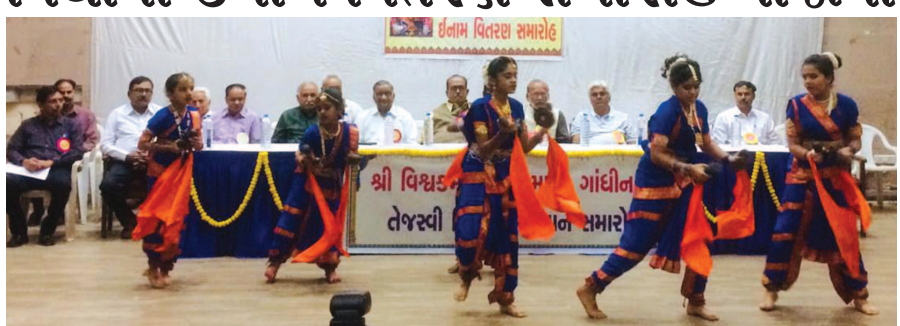
શ્રી વિશ્વકર્મા સેવા સમાજ, ગાંધીનગર દ્વારા તેજસ્વી વિદ્યાર્થીઓ માટે ઈનામ વિતરણ સમારોહનું આયોજન ડૉ. આંબેડકર હોલ, ગાંધીનગર ખાતે કરવામાં આવ્યું હતું.