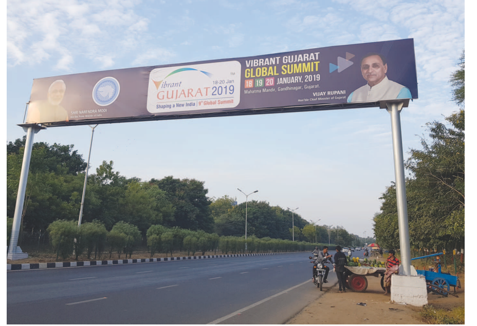
વાયબ્રન્ટ સમિટનું કાર્નિવલ - ડાઉન : શહેરમાં વાયબ્રન્ટ સમિટના આગમનના પગલે તડામાર તૈયારીઓ ચાલી રહી છે. ગાંધીનગરને જોડતા મુખ્ય રાજમાર્ગો પર વાયબ્રન્ટની કમાનો સ્થાન લઈ રહી છે. માર્ગો અને મકાનોને સજાવટ કરાઈ રહી છે. સેન્ટ્રલ વિસ્તારના ફુલ છોડને સાફ-સુક કરાઈને સજાવટ રહ્યા છે. આમ, ગાંધીનગર વાયબ્રન્ટ સમિટને આવકારવા થનગની રહ્યું છે.

જોવા મળી રહ્યો છે. ત્યારે આ સેન્ટ્રલ વર્જની રોનક નિખરવા માટે નવા રોપાઓની વાવણીનું કામ શરૂ કરવામાં આવ્યું છે. જેમાં બોગન વેલના નવા રોપાઓની વાવણી કરવામાં આવી રહી છે. નગરના ઘ અને ચ માર્ગ પર સ્થિત સેન્ટ્રલ વર્જમાં ૨૦ હજાર ચો મી ની જગ્યામાં આ પ્રકારનું પ્લાન્ટેશન કરવામાં આવશે. જેના અંતે ગુલાબી, સફેદ અને લાલ રંગના ફુલો નિખરશે. સેન્ટ્રલ વર્જના વિસ્તારમાં રખડતા ઢોર આંટા ન મારે તેમજ માર્ગ સલામતી અને રોપાઓની જાળવણીને ધ્યાને લઈ તંત્ર દ્વારા ગ્રીલ પણ લગાવામાં આવી રહી છે. ટુંક સમયમાં જ રોપાઓની વાવણીનું કામ પુર્ણ કરી દેવાશે. વાર્ષિક દરમિયાન મુખ્યમાર્ગોનો નજારો બદલાઈ જશે.