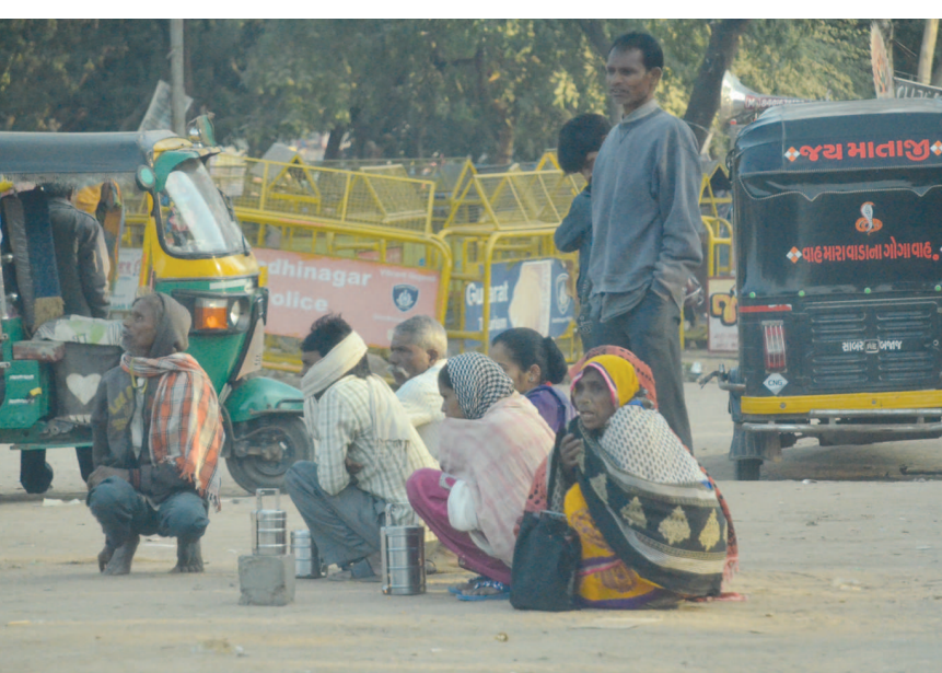
કડકડતી ઠંડી : છેલ્લા પાંચ દિવસથી તીવ્ર ઠંડીનું મોજું શહેરમાં ફરી વળ્યું છે. હાડ થીજાવતી ઠંડીમાં શ્રમિકો ભારે હાલતી અનુભવે છે. રોજ સવાર - સાંજ મજૂરી કરી પેટીયું રળતા શ્રમિકો માટે કડકડતી ઠંડી જાણે વિલન બની રહી હોય એમ અનુભવાય છે.