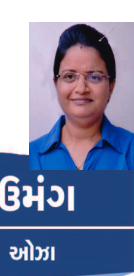
રંગ-ઉમંગ કાનન યોગા